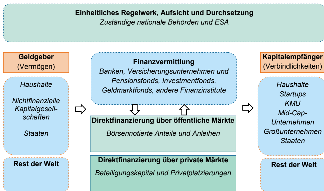
Abbildung 1: Schematischer Überblick über die Kapitalmärkte im Finanzsystem

In den letzten Jahrzehnten sind die Kapitalmärkte in der EU stark gewachsen. So stieg die Börsenkapitalisierung in der EU von 1,3 Billionen EUR im Jahr 1992 (22 % des BIP) bis Ende 2013 auf insgesamt rund 8,4 Billionen EUR (ca. 65 % des BIP) an. Die ausstehenden Schuldverschreibungen erreichten im Jahr 2013 einen Gesamtwert von über 22,3 Billionen EUR (171 % des BIP), im Vergleich zu 4,7 Billionen EUR (74 % des BIP) im Jahr 1992 3 .