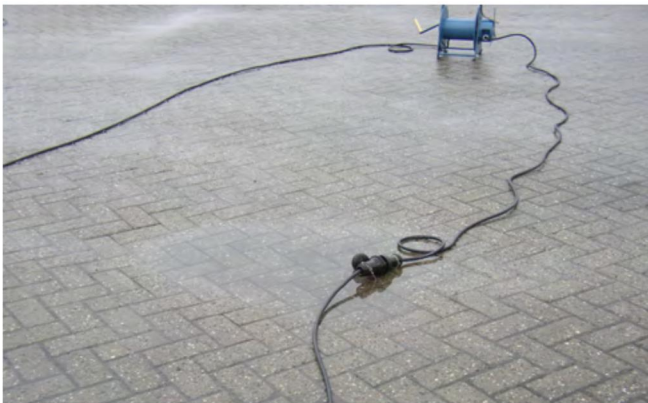
Bild 1: Druckwasserdichte Steckvorrichtung, leicht eingetaucht während eines Ausbildungsdienstes

Das Bild zeigt, dass auch auf scheinbar ebenen und befestigten Flächen mit einem Eintauchen der Steckvorrichtungen bei Nässe gerechnet werden muss.