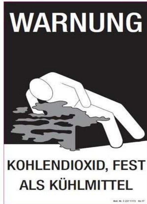
Bild 1: Warnkennzeichen für Fahrzeuge für den Transport von Trockeneis