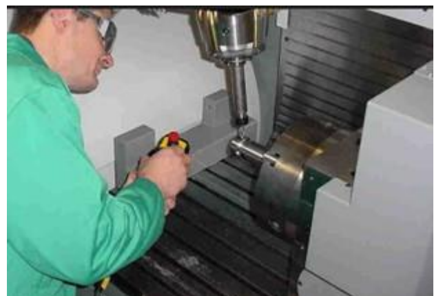
Abbildung 1 – Prozessbeobachtung bei Einzelfertigung auf einem Bearbeitungszentrum.

Diese Vorgehensweise ist auch für den größten Teil der Maschinen richtig und ausreichend, wird doch so ein Höchstmaß an Sicherheit für die Nutzenden erreicht. Bei bestimmten Fertigungsabläufen hat sich aber gezeigt, dass es unter Umständen nicht genügt, nur Abläufe wie das Einrichten oder den manuellen Betrieb zu beobachten. Manchmal muss auch ein automatischer Prozess zeitweise beobachtet werden (siehe auch DIN EN ISO 11161, Anhang D [1]).