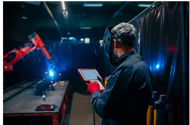
Abbildung 2 – Prozessbeobachtung und Optimierung beim Auftragschweißen mit Robotern

Für Industrieroboter gilt DIN EN ISO 10218-1 [4]. Die Vorgaben für die Beobachtung von Prozessen sind denen bei Werkzeugmaschinen ähnlich. Zwar existiert zur Programmüberprüfung eine Betriebsart, bei der der Automatikbetrieb beobachtet werden kann, jedoch auch hier nur unter Verwendung eines Zustimmungsschalters.