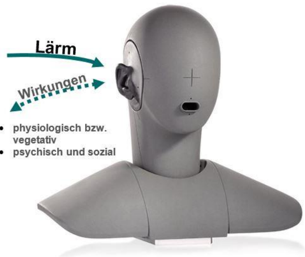
Abbildung 1 – Einflüsse von nicht gehörschädigendem Lärm auf den Menschen

Bei niedrigeren Pegeln ist Lärm deshalb aber längst nicht ungefährlich. Hier können die sogenannten „extra-auralen“ Lärmwirkungen auftreten. Sie äußern sich durch physiologische, vegetative (unbewusst ablaufende körperliche