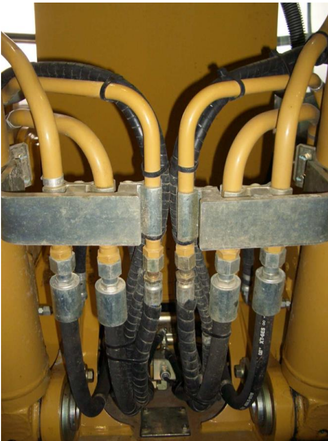
Bild3: Leckagefreie ältere Mobilhydraulik

Da es einerseits kaum möglich erscheint, äußere Leckage im hydraulischen System vollständig dauerhaft aus-zuschließen und es andererseits betriebstechnisch kaum sinnvoll erscheint, die gesamte hydraulische Ausrüstung einer Maschine (und damit mögliche Stellen der äußeren Leckage) von der Umgebung vollkommen hermetisch zu trennen, bleibt dem Hersteller einer Maschine meist keine andere Möglichkeit, als die Hydraulikanlage derart zu gestalten, dass diese für möglichst lange Betriebszeit frei von äußerer Leckage bleibt (siehe Bild 3).