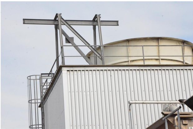
Abbildung 2 – Ausbauträger auf Hallendach