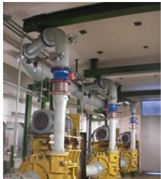
Abbildung 1 – Ausbauträger in Pumpenstation

Die unter Nr. 2 und Nr. 3 genannten Anwendungsfälle gelten im Sinne dieser „Fachbereich AKTUELL“ nicht als Ausbauträger. Die nachfolgenden Regelungen gelten für sie nicht.