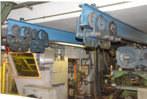
Abbildung 4 Ausbauträger mit Rollenfahrwerk