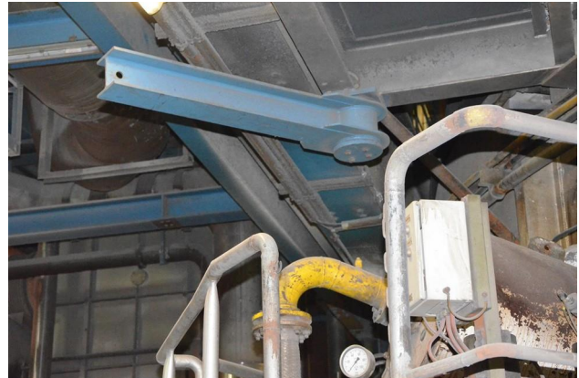
Abbildung 3 – Ausbauträger als Schwenkausleger