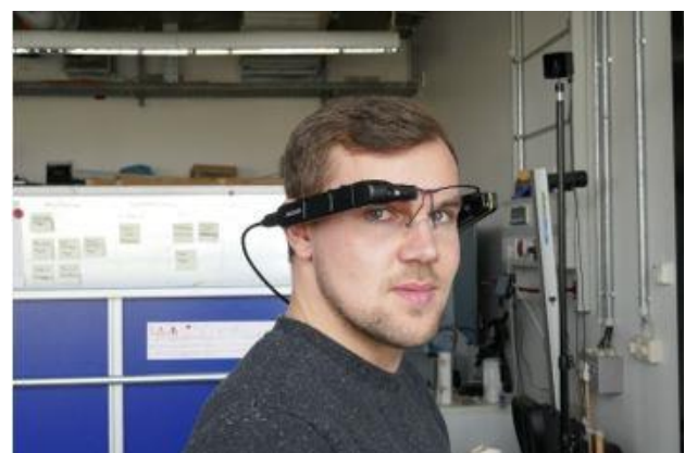
Abbildung 3 – Beispiel Arbeiten mit einer Datenbrille

Von Beispiel zu Beispiel nimmt die Komplexität der durchgeführten Tätigkeit hinsichtlich relevanter Faktoren, wie Arbeitsinhalt, Arbeitsaufgabe, Informationsmenge, zu.