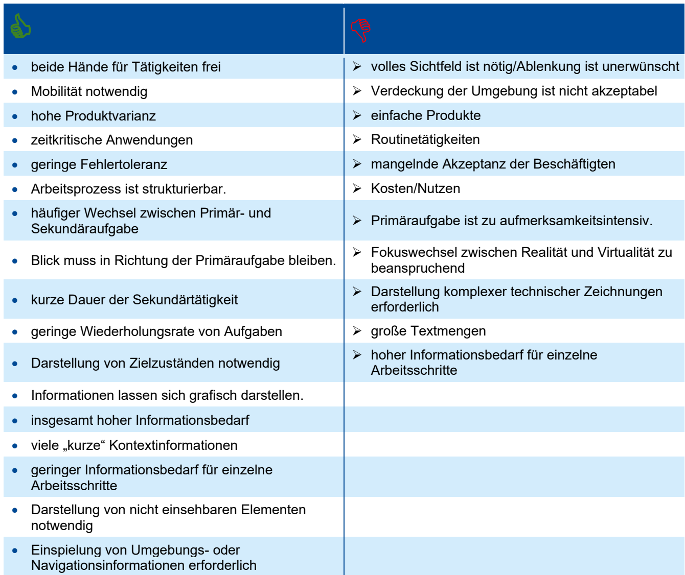
Tabelle 1 – Indikatoren für oder gegen den Einsatz von Datenbrillen [4]