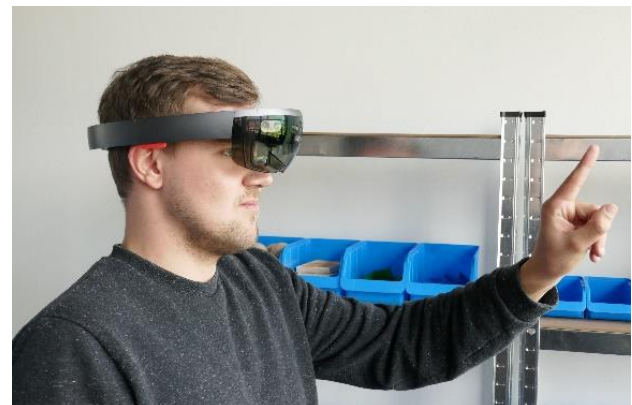
Abbildung 1 – Beispiel Nutzer einer Datenbrille

Die Ziele dieser „Fachbereich AKTUELL“ sind,