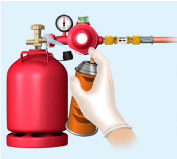
Abbildung 3 – Dichtheitskontrolle mittels Lecksuchspray nach Anschluss der Druckregeleinrichtung an die Flüssiggasflasche

Bei der Aufstellung von Versorgungsanlagen mit Flüssiggasflaschen gelten darüber hinaus folgende Anforderungen: