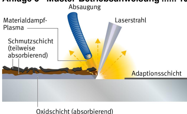
Abbildung 1 – Prinzip der Oberflächenreinigung mit Laserstrahlung