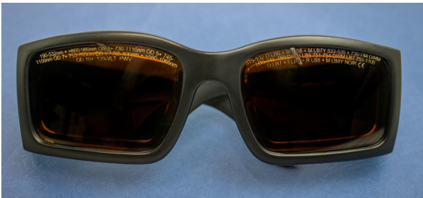
Abbildung 2 - Laserschutzbrille mit Kennzeichnung auf dem Brillenglas und mit Kennzeichnung am Brillengestell

Geeignete Laser-Schutzbrille tragen. Weitergehende Informationen finden Sie in der DGUV Information 203-042 [3].