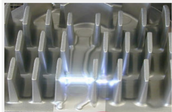
Abbildung 4 - Laserreinigung an einem stark strukturierten Bauteil mit erkennbarer, reflektierter Strahlung

Aus der Zusammensetzung der abzutragenden Schicht und der Beschaffenheit der Materialoberfläche können sich weitere Gefährdungen ergeben, die bei der Planung der Arbeiten berücksichtigt werden müssen. Das betrifft Gefahrstoffe, die durch thermische Zersetzung aus den Beschichtungsstoffen freigesetzt werden können und die Reflexionseigenschaften der Oberfläche, die sowohl die Intensität als auch die Ausbreitung der reflektierten und gestreuten Strahlung beeinflussen. Dabei spielt auch die Geometrie des Werkstücks eine Rolle. Winkel, Rohre, Schweißnähte etc. führen zu einer veränderten Strahlausbreitung.