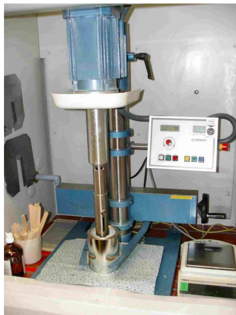
Bild 7: Labor-Dissolver mit ausreichenden Schutzeinrichtungen: überwachte Spann- zange, einstellbare Wellenschutz- hülse