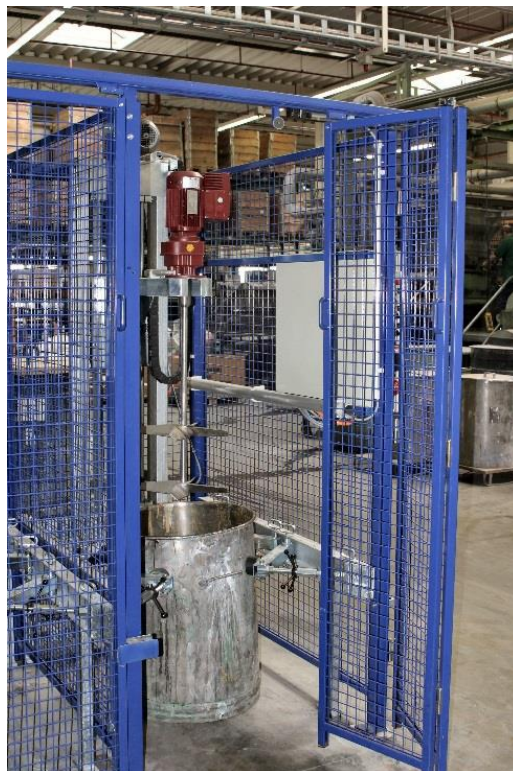
Bild 5: Durch (verriegelte) trennende Schutzeinrichtungen gesichertes Rührwerk