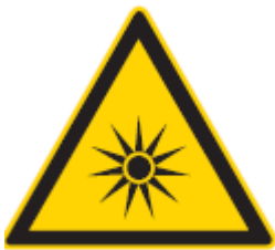
Bild 1: Das Zeichen „Warnung vor optischer Strahlung“ muss bei den Risikogruppen 2 und 3 angebracht sein [7]

Hersteller bestätigen das Einhalten der Sicherheitsanforderungen durch die CE-Kennzeichnung. Beim Design von Leuchten ist darauf zu achten, dass diese entblendet werden.