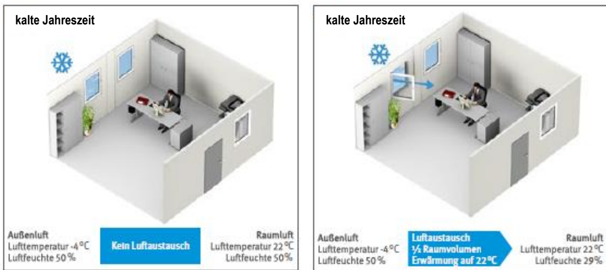
Bild 1: Relative Luftfeuchte im Büro vor dem Lüften (links) und nach dem Lüften (rechts) in der kalten Jahreszeit.

Da warme Luft mehr Wasserdampf aufnehmen kann als kalte Luft, sinkt im Winter die relative Luftfeuchte, wenn die kalte Außenluft in den Innenraum gelangt und erwärmt wird. Die Luft wird dabei „trockener“ und es können relative Luftfeuchten von unter 30 % auftreten. Das folgende Beispiel ist der DGUV Information 215-520 „Klima im Büro“ entnommen: