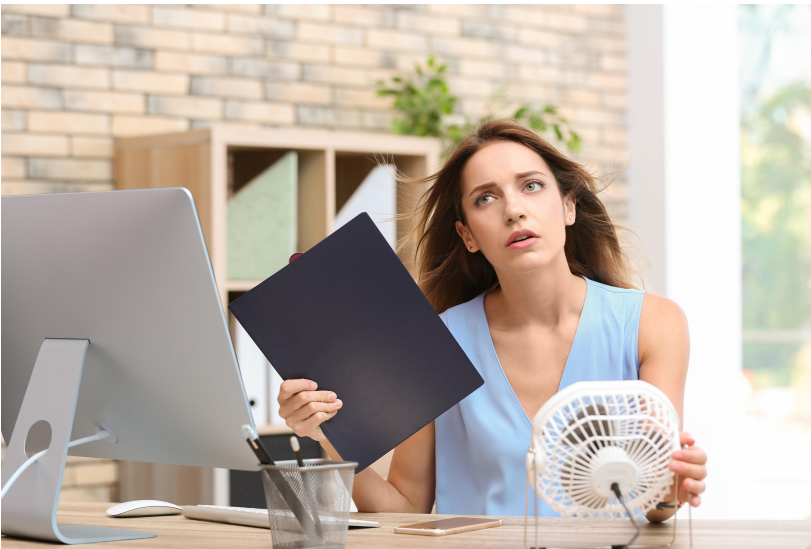
Abbildung 1: Belastete Beschäftigte durch sommerliche Wärme am Arbeitsplatz und beispielhafte Schutzmaßnahmen (Ventilator, Getränke, angepasste Kleidung)

Für Arbeitsplätze, die dem Einfluss der sommerlichen Wärme unterliegen, sind die Anforderungen der Arbeitsstättenverordnung (ArbStättV) [3] mit den zugehörigen Technischen Regeln für Arbeitsstätten (ASR) einzuhalten. Tätigkeiten mit extremer Hitzebelastung (Hitzearbeit) unterliegen nach der Verordnung zur arbeitsmedizinischen Vorsorge (ArbMedVV) [4] in Verbindung mit der Arbeitsmedizinischen Regel AMR 13.1 [5] der Pflichtvorsorge. Näheres ist der DGUV Empfehlung für arbeitsmedizinische Beratungen und Untersuchungen – Hitzearbeiten [6] zu entnehmen.