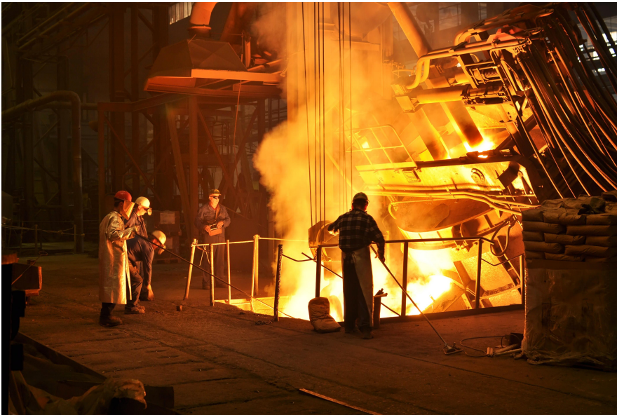
Abbildung 2: Typischer Hitzearbeitsplatz im Stahlwerk (aus DGUV Information 213-002)