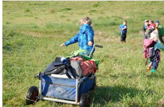
Abb. 4 Förderung von Entwicklungsreizen durch Bewegung im Freien

Bewegung ist grundlegend für die kindliche Entwicklung und hat für das Wohlbefinden sowie die Sicherheit und Gesundheit von Kindern eine