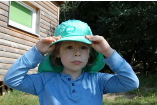
Abb. 6 Kopfbedeckung als Schutz vor Sonneneinstrahlung

An Tagen mit erhöhten Ozonwerten sollten die Kinder extreme Anstrengungen vermeiden. Eine erhöhte Ozonkonzentration kann zu Hustenreiz, Reizung von Hals und Rachen und Kopfschmerzen führen. Generell reagieren Kinder empfindlicher auf erhöhte Ozonkonzentrationen als Erwachsene. Befinden sich besonders empfindliche Kinder in der Gruppe, sollte ein Alternativprogramm angeboten werden.