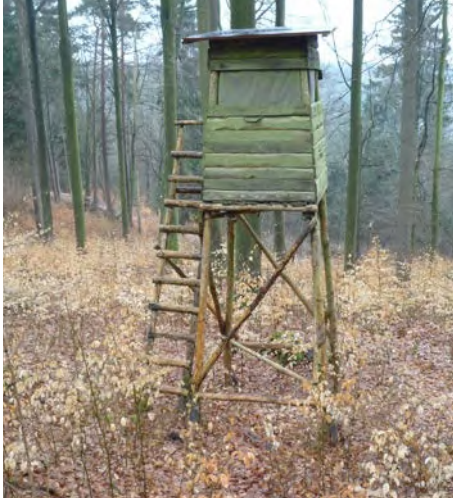
Abb. 11 Hochsitze dürfen von der Waldkita nicht genutzt werden