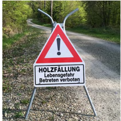
Abb. 9 Warnschild für Holzfällungen

Freiliegende Einzelstämme, die sicher und fest im Erdreich liegen, können jedoch zum Balancieren oder Sitzen genutzt werden.