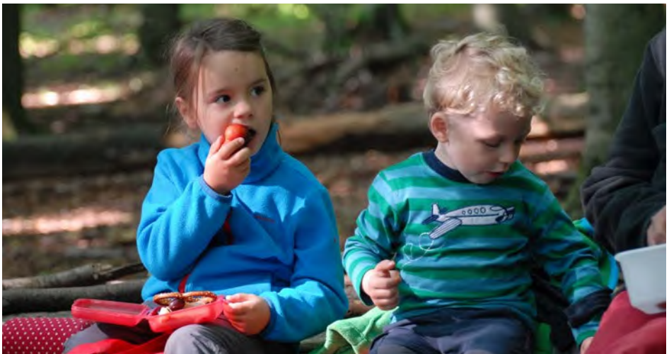
Abb. 2 Frühstück in einem Waldkindergarten

Bedürfnissen nachzugehen. Dies kann sowohl die untersuchende Entdeckungsreise, das Ausleben des Bewegungsdranges oder das Ausruhen unter dem Blätterdach sein. Im angeleiteten Spiel werden die Entdeckungen der Kinder durch Sing-, Kreis- und Regelspiele aufgegriffen, es werden Mal- und Bastelangebote unterbreitet, Geschichten erzählt, Bücher angeschaut und vieles mehr. Den Abschluss des Kindergartenabends bildet der Abschiedskreis am Treffpunkt, welcher meist durch ein Lied bestimmt ist. Hier haben die Eltern Gelegenheit, sich mit anderen Eltern oder den pädagogischen Fachkräften auszutauschen.