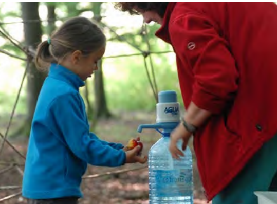
Abb. 13 Händewaschen mithilfe eines Wasserkanisters im Waldkindergarten

Der Toilettengang wird in den einzelnen Waldkindergärten unterschiedlich geregelt. Die Benutzung einer Campingtoilette ist dabei eine von mehreren Möglichkeiten.