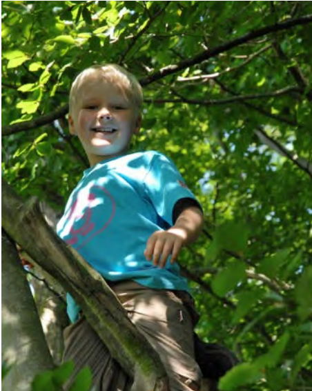
Abb. 7 Beispiel eines Kletterbaumes

beim Klettern zu gewinnen. Außerdem sollte eine geeignete Auswahl der Kletterbäume, auch in Absprache mit dem zuständigen Forstamt bzw. dem Waldbesitzer, erfolgen. Hierbei ist unter anderem der Gesundheitszustand der Bäume ein wichtiges Kriterium. Ein niedriger Astansatz erleichtert den Einstieg und vor allem auch wieder das Herunterklettern. Die Kletterhöhe ist nach den Umgebungsbedingungen sowie den Fertigkeiten der Kinder auszurichten. Darüber hinaus ist sie entsprechend der Regelung für Spielplatzgeräte nach