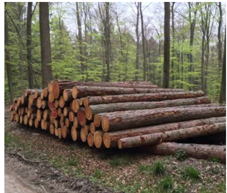
Abb. 10 Holzstapel dürfen nicht betreten werden