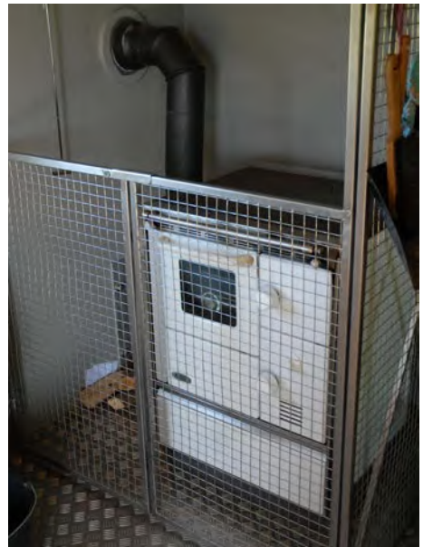
Abb. 12 Holzofen mit Schutzgitter