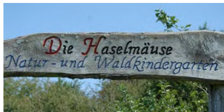
Abb. 1 Der Waldkindergarten „Die Haselmäuse“

Naturverbundene Früherziehung findet, je nach Region, auch in anderen Einrichtungsformen wie in Strand- oder Bauernhofkindergärten statt.