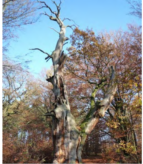
Abb. 8 Totholz

Mit Totholz werden tote Baumstümpfe und abgestorbene Äste und Zweige bezeichnet (Abbildung 8). Da sie die Lebensgrundlage für viele Tier- und Pflanzenarten bilden, werden sie bewusst im Wald belassen, stellen aber besonders nach Stürmen eine Gefahr für die Waldbenutzer dar. Die pädagogischen Fachkräfte sollten Absprachen mit dem zuständigen Forstamt oder Waldbesitzer treffen und Aufenthaltsbereiche meiden, in denen sich bekannterweise viel Totholz befindet. Besonders nach Stürmen sollte auf Feld- und Wiesengebiete ausgewichen werden.