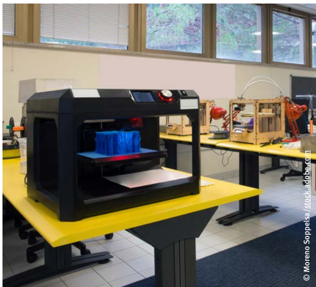
In einem separaten Raum aufgestellte Tischdrucker

Für ein vernünftiges Druckergebnis und einer sicheren Bedienung des 3D-Tischdruckers sollte dieser über ein Temperaturprogramm und verschiedene Druckgeschwindigkeiten verfügen.