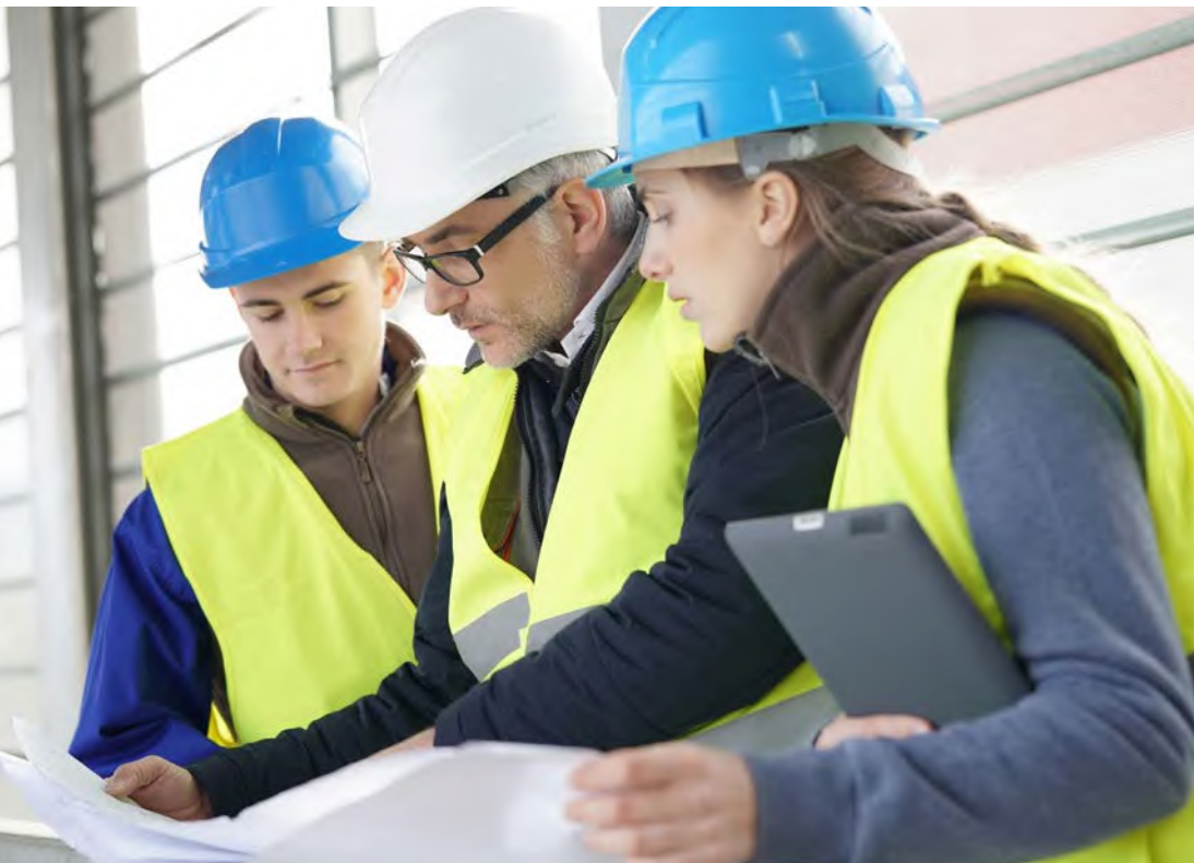
Abb. 6 Durchführung einer Unterweisung

Verhalten im Notfall besprochen werden. Darüber hinaus muss die tätigkeitspezifische Unterweisung am Arbeitsplatz erfolgen. Hier kann die bzw. der Unterweisende am Beispiel der Arbeitsmittel erläutern, auf was die Schülerin oder der Schüler zu achten hat, kann auf Gefahrenstellen und -situationen aufmerksam machen und die ergriffenen Schutzmaßnahmen erläutern. Die bzw. der Unterweisende muss sich davon überzeugen, dass die Inhalte der Unterweisung verstanden wurden und auch umgesetzt werden können. Außerdem muss die Unterweisung im Betrieb dokumentiert werden.