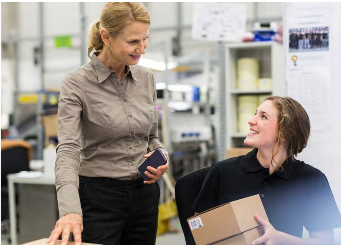
Abb. 3 Der Besuch der Praktikumsleitung im Praktikumsbetrieb

Hilfestellungen sowie ein Verweis zu Lehrmaterialien für die unterrichtliche Vorbereitung werden in Anlage 7 aufgeführt. Ziel der Vorbereitung ist es, die Schülerinnen und Schüler in die Lage zu versetzen, kritische Situationen zu erkennen und sich mit Fragen an ihre Ansprechperson im Betrieb zu wenden. Sie sollen verstehen, dass sie in unbekanntem Situationen besser nachfragen, bevor sie eigenmächtig handeln und dadurch ggf. einen Unfall erleiden (siehe auch Anlage 7 „Unterrichtliche Vorbereitung“). Die unterrichtliche Vorbereitung dient auch der Unterweisung der Schülerinnen und Schüler und muss dokumentiert werden. Dies ist z. B. durch einen Eintrag ins Klassenbuch oder Kursbuch möglich. Alternativ kann ein gesondertes Unterweisungsformular genutzt werden, auf dem sowohl die unterweisende Person als auch die Schülerinnen und Schüler unterschreiben und die Unterweisung zu den behandelten Themen bestätigen (siehe auch Anlage 8 „Dokumentation allgemeine Unterweisung“).