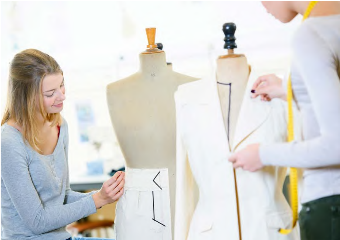
Abb. 5 Die Einblicke in ein Berufsfeld sind vielfältig