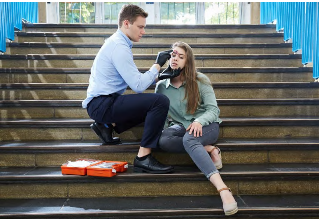
Abb. 7 Jeder Unfall muss der Schule gemeldet werden

Das Prinzip der Unfallmeldung ist in Abbildung 8 dargestellt. Für die Unfallverhütung in den Betrieben gelten neben den staatlichen Arbeitsschutzvorschriften die spezifischen Regelwerke der gesetzlichen Unfallversicherung für eben diesen Betrieb, also die DGUV Vorschrift 1 „Grundsätze der Prävention“ ebenso wie branchen- oder betriebsspezifische Unfallverhütungsvorschriften. Zu Beginn ihres Praktikums werden die Schülerinnen und Schüler daher durch den Betrieb über die für „ihren“ Betrieb geltenden Vorschriften und Maßnahmen zur Sicherheit und Gesundheit informiert – im Praktikum unterliegen auch sie diesen Unfallverhütungsvorschriften. Für Sachschäden gelten unterschiedliche Regelungen. Informationen dazu enthalten die landesspezifischen Regelungen (siehe Kapitel 5.2).