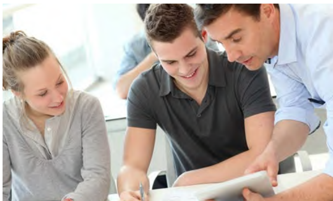
Abb. 1 Die Praktikumsleitung bespricht wichtige Aspekte mit den Schülerinnen und Schülern

Die Schulleiterin bzw. der Schulleiter kann die Verantwortung auf andere Lehrkräfte delegieren. Wenn nicht bereits in schulrechtlichen Regelungen der Länder gefordert, bietet es sich an, in der Schule eine fachkundige Lehrkraft als Praktikumsleitung zu benennen. Diese berät die Schülerinnen und Schüler bei der Auswahl der Praktikumsstelle, begleitet die Durchführung und steht als Ansprechperson zur Verfügung. Zu ihrem Verantwortungsbereich gehört