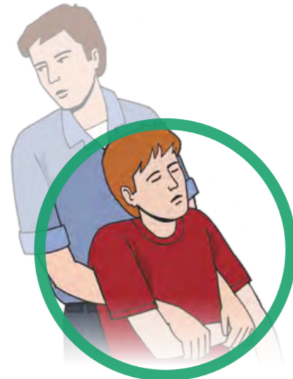
Person ggf. aus dem Gefahrenbereich retten