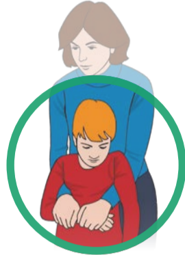
Kind ggf. aus dem Gefahrenbereich retten