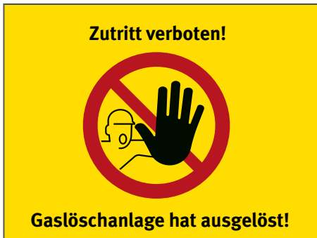
Abb. 1 Beispiel eines Leuchtzeichens

An den Zugängen zu den Flutungsbereichen und Gefährdungsbereichen müssen zusätzlich Warnleuchten oder Leuchtzeichen auf den ausgelösten Zustand der Löschanlage hinweisen, wenn der Zutritt nicht durch andere geeignete Maßnahmen verhindert wird.