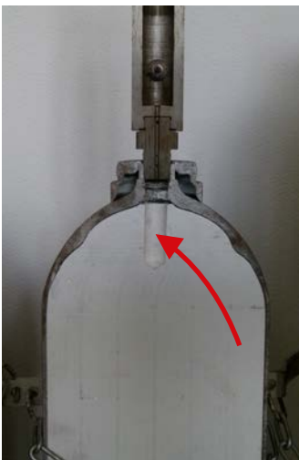
Abb. 3 Querschnitt durch eine Acetylenflasche mit porösem Material im Behälter (weiß) und dem freien Volumen am Flaschenanschluss (roter Pfeil)