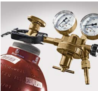
Abb. 2 Charakteristischer Flaschendruckminderer mit Überwurfbügel