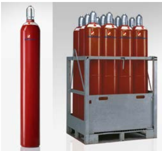
Abb. 1 50-l Acetylenflaschen, links einzeln, rechts 12 Flaschen palettiert