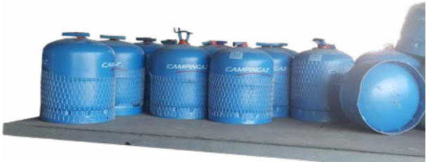
Abb. 3 Butangasflaschen