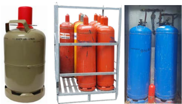
Abb. 2 Beispiele für 5-kg bzw. 33-kg-Flüssiggasflaschen