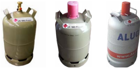
Abb. 1 11-kg-Flüssiggasflaschen unterschiedlicher Hersteller