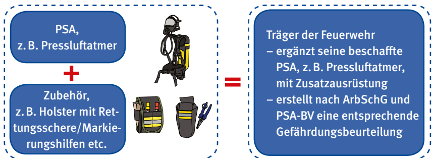
Bild 2: Anforderungen an die Kombination von Zusatzausrüstung und PSA

Wird eine Zusatzausrüstung mit einer PSA kombiniert, muss die Trägerin bzw. der Träger der Feuerwehr durch eine Gefährdungsbeurteilung feststellen und prüfen, ob die Schutzwirkung der PSA weiterhin gegeben ist, bzw. inwieweit weitere neue Gefährdungen durch die Kombination entstehen. Die Gefährdungsbeurteilung nach Arbeitsschutzgesetz und PSA-Benutzerverordnung ist zu dokumentieren.