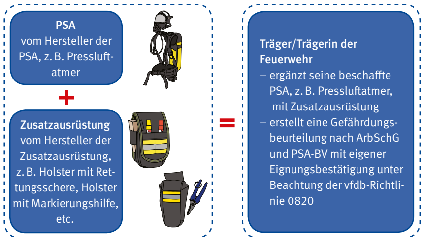
Bild 3: Anforderungen an die Kombination von Zusatzausrüstung mit PSA

Kombiniert der Träger bzw. die Trägerin der Feuerwehr eine nach der vfdb-Richtlinie 0820 für geeignet erklärte und gelistete Zusatzausrüstung, stellt die Bestätigung auf Basis der Prüfung und Bewertung nach vfdb-Richtlinie 0820 einen wesentlichen Bestandteil seiner bzw. ihrer Gefährdungsbeurteilung nach ArbSchG und PSA-BV dar (siehe Bild 3).