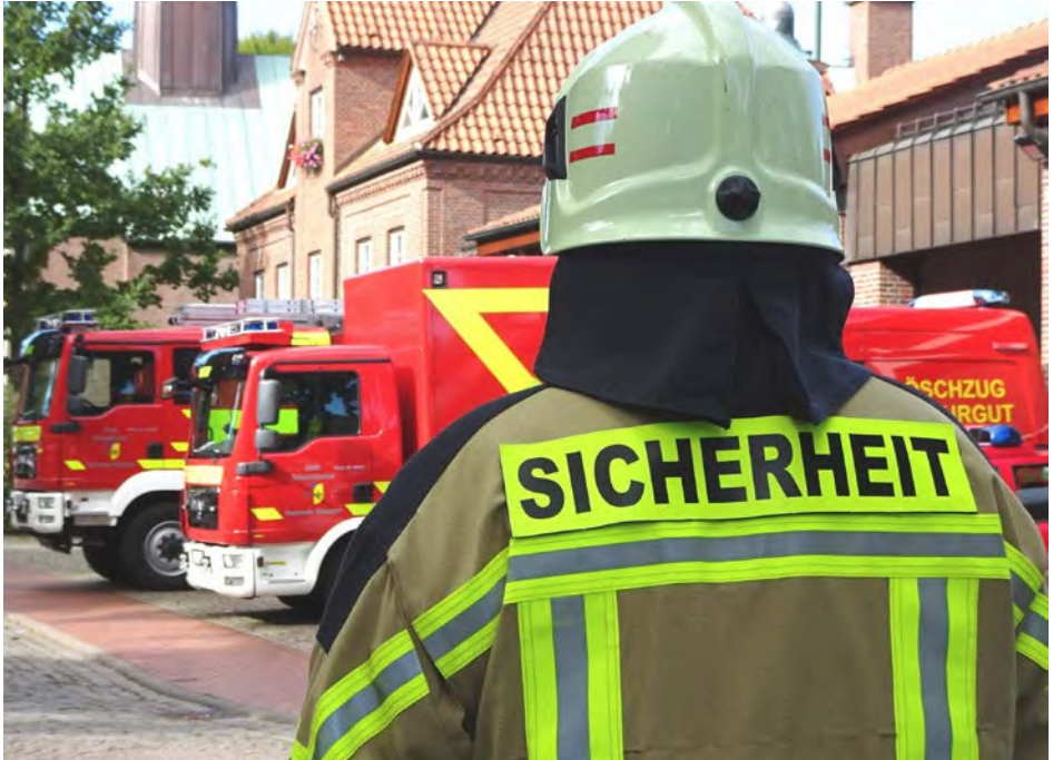
Abb. 5 Bei der Gefährdungsbeurteilung sind auch die psychischen Belastungsfaktoren zu ermitteln.