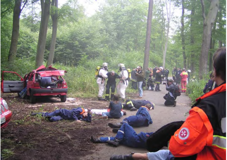
Abb. 11 Bei Terrorlagen kommen die individuellen Bewältigungsstrategien schnell an die Grenzen.

auf Hilfe durch die PSNV-Kräfte einzulassen. Es sollte jedoch keine Vorbehalte geben, nach einer außergewöhnlichen psychischen Belastung im Einsatz, Hilfsangebote anzufordern. Können Einsatzkräfte das Erlebte nur schwer verarbeiten, können die Symptome zu einer Einschränkung der Lebensqualität und dem Abbrechen der sozialen Kontakte führen. Es ist die Möglichkeit gegeben, eine behandlungsbedürftige psychische Störung zu entwickeln.