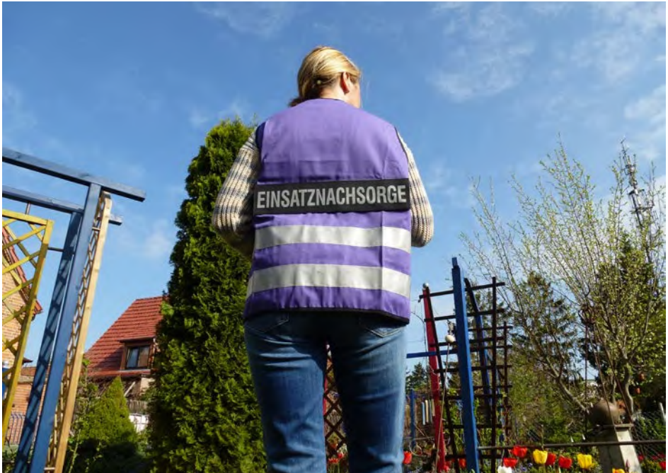
Abb. 12 Fachkräfte der PSNV sind Menschen wie du und ich.