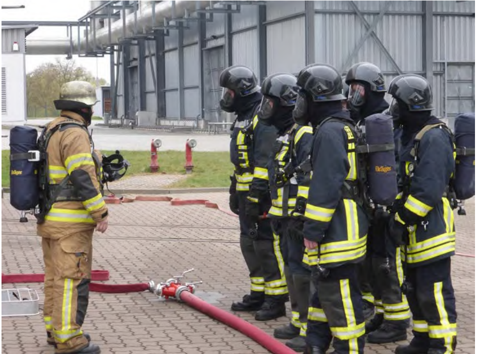
Abb. 7 Die Führungskraft hat eine besondere Verantwortung.

Einsatzkräfte (und dazu zählen auch die Führungskräfte!) helfen an Brand-, Unfall- und anderen Schadenstellen. Oftmals arbeiten an einer Einsatzstelle die Angehörigen verschiedener Einsatzorganisationen eng zusammen. Zu den als besonders belastend empfundenen Einsätzen zählt z. B. die Bergung von Unfallopfern, insbesondere von Kindern oder persönlich bekannten Personen. Wenn Einsatzkräfte selbst gefährdet sind oder andere Einsatzkräfte schwer verletzt oder gar getötet werden, stellt dies ebenfalls eine besonders außergewöhnliche Belastung dar.