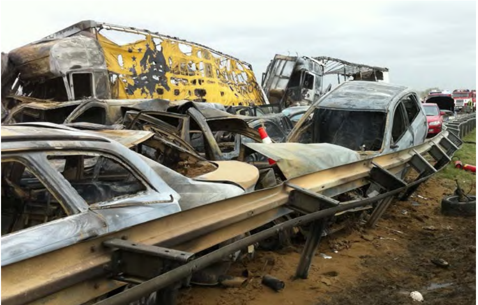
Abb. 1 Ein derartiger Verkehrsunfall stellt für Einsatzkräfte ein außergewöhnlich belastendes Ereignis dar.