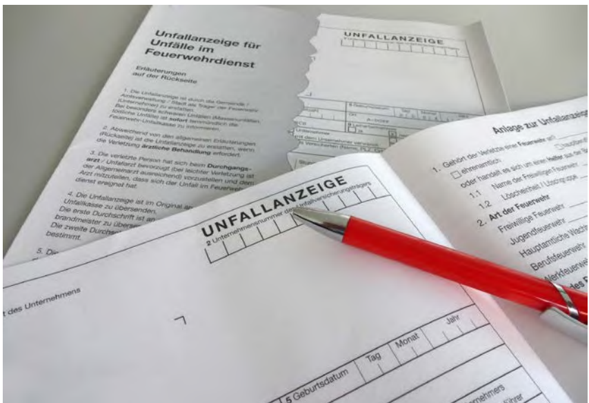
Abb. 4 Psychische Gesundheitsschäden können ein Arbeitsunfall sein.

heitliche Vorgehensweise im Bereich der psychischen Gesundheitsstörungen festgelegt. Dabei kann im ersten Schritt eine Psychotherapeutin bzw. ein Psychotherapeut beauftragt werden, fünf probatorische Sitzungen ambulant durchzuführen. Bei entsprechend begründeter Notwendigkeit können auf Antrag weitere psychotherapeutische Maßnahmen genehmigt werden. Über eine stationäre Behandlung entscheidet der zuständige Unfallversicherungsträger unter Berücksichtigung der ärztlichen Empfehlungen. Weitere Fachärzte bzw. Fachärztinnen (z. B. Psychiatrie, Neurologie) können hinzugezogen werden.