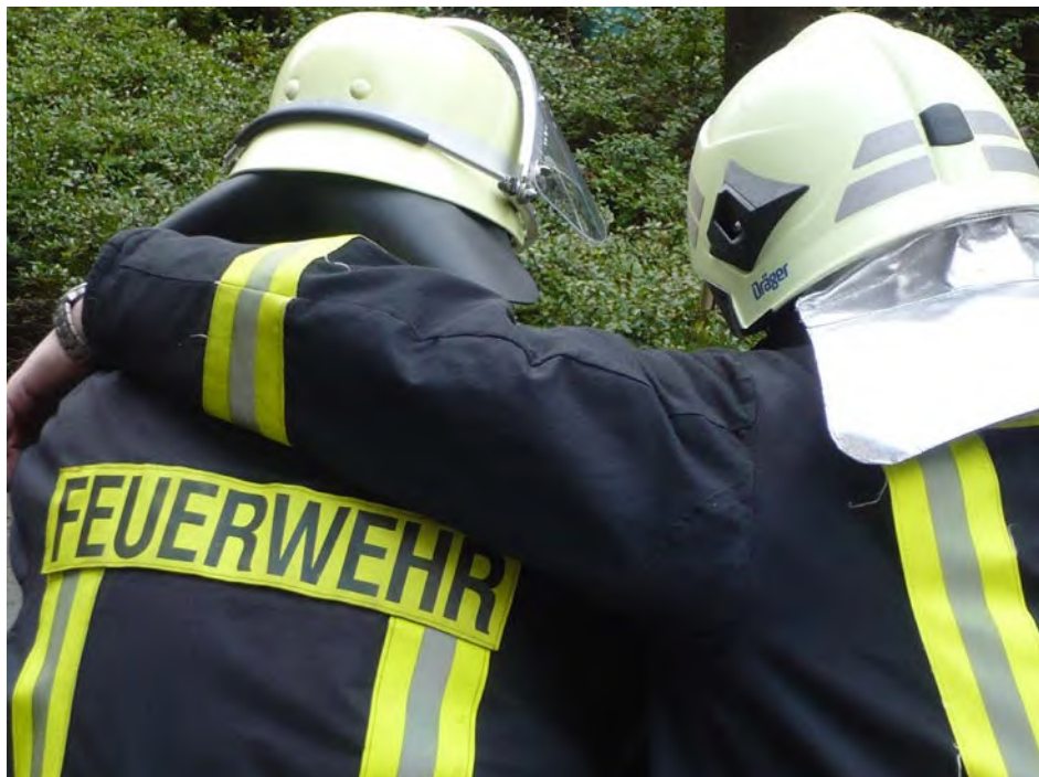
Abb. 13 „Peer“ bedeutet: „Gleicher oder Gleiche unter Gleichen“.

eigene Einsatzerfahrung mitbringt und ihre persönliche Sozialkompetenz durch verschiedene Schulungen im psychosozialen Bereich erweitert hat. Durch den „Stallgeruch“, d. h. selbst über Einsatzerfahrung zu verfügen, erlangen Peers einen besseren Zugang zu betroffenen Einsatzkräften sowie eine breitere Akzeptanz. Im Teameinsatz unterstützt er oder sie die psychosoziale Fachkraft und „bricht das Eis“, um z. B. den Zugang zu weiteren PSNV-Maßnahmen vorzubereiten und zu erleichtern. Peers verfügen neben fachlich fundierten Kenntnissen der PSNV für die Zielgruppe der Einsatzkräfte über umfassende und langjährige Erfahrung als haupt- oder ehren-