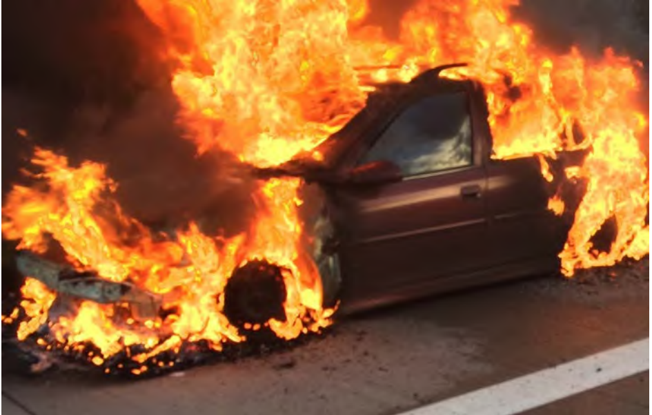
Abb. 8 Eine besondere Belastung kann z. B. entstehen, wenn bei einem Einsatz wichtige Informationen fehlen.