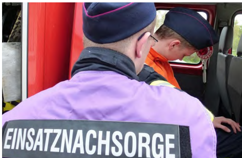
Abb. 9 Die Angebote und Arbeitsweise der PSNV-E müssen in einer Einsatzorganisation bekannt sein.

Ein Risikofaktor für das Entstehen von psychischen Erkrankungen nach traumatischen Ereignissen ist ein Mangel an sozialer Unterstützung. Für Einsatzkräfte ist mit der Vorhaltung der PSNV-E vorgesorgt und somit sollte nicht gezögert werden, diese Hilfe auch einzufordern bzw. anzunehmen.