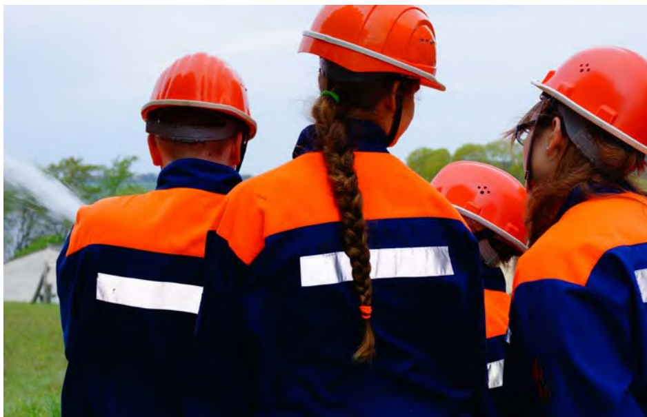
Abb. 6 Insbesondere Kinder und Jugendliche als Mitglieder von Einsatzorganisationen sind besonders schutzbedürftig!

Aus diesem Grund ist z. B. entsprechend der DGUV Vorschrift 49 „Feuerwehren“ neben einer grundlegenden körperlichen und fachlichen Eignung, eine Teilnahme am Feuerwehreinsatz für Kinder und Jugendliche als Feuerwehrangehörige grundsätzlich nicht vorgesehen.