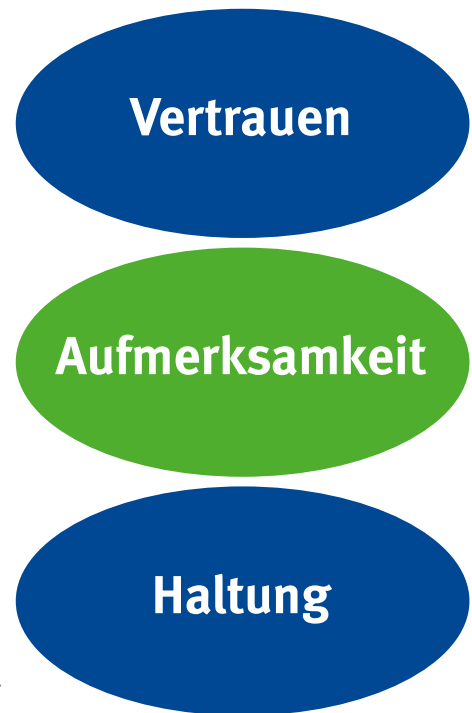
Abb. 4 gesunde und sichere Arbeitskultur

In der Psychologie geht man davon aus, dass sich Menschen 5-7 neue Informationen auf einmal merken können, z. B. die 5 Erfolgsgeheimnisse. Allerdings gehen im Alltagsgeschäft auf dem Weg zwischen Gedächtnis und Handlung auch 5-7 Informationen wieder verloren. Greifen Sie sich daher erst einmal nur eine oder zwei Ideen heraus, die Sie umsetzen oder ausprobieren wollen. Wenn Sie damit Erfahrungen gesammelt haben, können Sie sich an eine weitere Idee wagen und diese erproben. Um herauszufinden, womit Sie beginnen sollten, können Sie auch den "Kurz-Check Handlungsfelder" für sich bearbeiten, denn in einer gesunden Unternehmenskultur vertraut man sich untereinander, ist aufmerksam und vertritt eine sichere Haltung (vgl. Abb. 4).