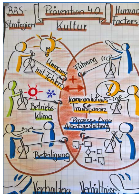
Abb. 2 erfolgreiche Prävention; Begriffserklärungen unter www.dguv.de - Webcode d162327