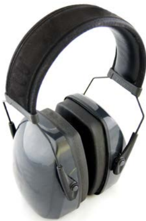
Abb. 1 Kapselgehörschützer

Hart gewordene Dichtungskissen sind nicht nur un bequem, sie vermindern auch die Schutzwirkung des Gehörschützers erheblich. Deshalb vergessen Sie bitte nicht, die Dichtungskissen regelmäßig auszutauschen.