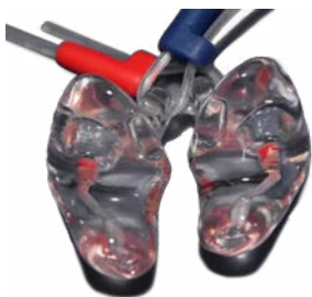
Abb. 8 Gehörschutz- Otoplastik

Ein sicherer Schutz wird nur erreicht, wenn die Gehörschutz-Otoplastik vor der ersten Verwendung und danach in regelmäßigen Abständen von maximal drei Jahren überprüft wird. Lassen Sie sich das richtige Einsetzen z. B. vom Hersteller oder Lieferanten der Gehörschutz-Otoplastik oder Ihrer Betriebsärztin bzw. Ihrem Betriebsarzt zeigen.