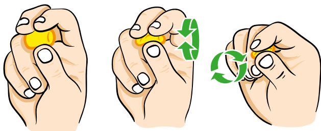
Abb. 2 Zusammenrollen von Gehörschutzstöpseln

Die richtige Handhabung – insbesondere bei den weitverbreiteten Schaumstoffstöpseln – will geübt sein, da sonst die Schalldämmung stark reduziert werden kann. Nur bei korrektem Sitz wird ein optimaler Schutz erreicht.