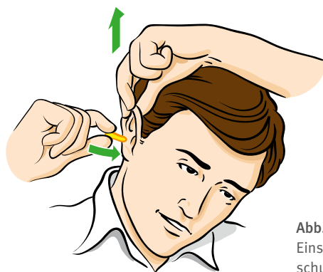
Abb. 3 Einsetzen von Gehörschutzstöpseln