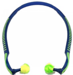
Abb. 7 Bügelstöpsel