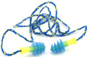
Abb. 6 Fertig geformte Gehörschutzstöpsel

Eine Besonderheit sind Bügelstöpsel, welche sich besonders leicht auf- und absetzen lassen und deshalb für häufiges kurzeitiges Betreten von Lärmereichen geeignet sind. Ihre Schutzwirkung ist jedoch geringer.