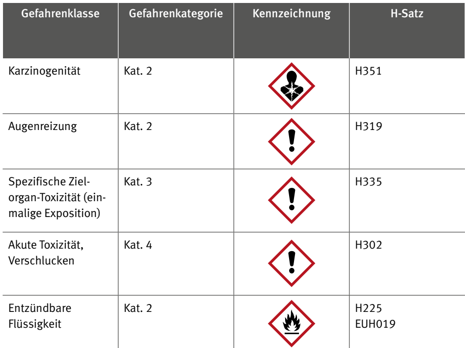
Tabelle 1: Einstufung und Kennzeichnung von THF nach CLP-Verordnung*

Nach der Verordnung (EU) 1272/2008 zur Einstufung und Kennzeichnung von Chemikalien (CLP-Verordnung) ist THF als Gefahrstoff eingestuft [10]. Zusätzlich ist THF mit dem Signalwort „Gefahr“ zu kennzeichnen.