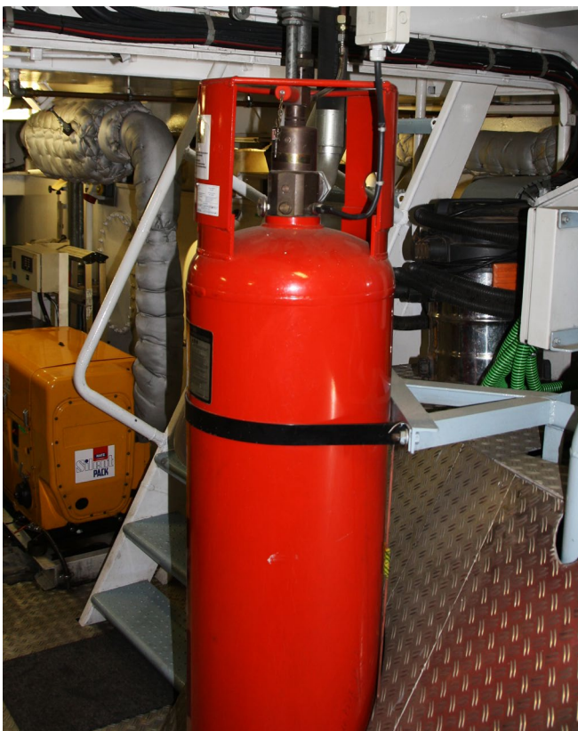
Abb. 5 Prüfungen sind auch eine Frage der Verantwortung