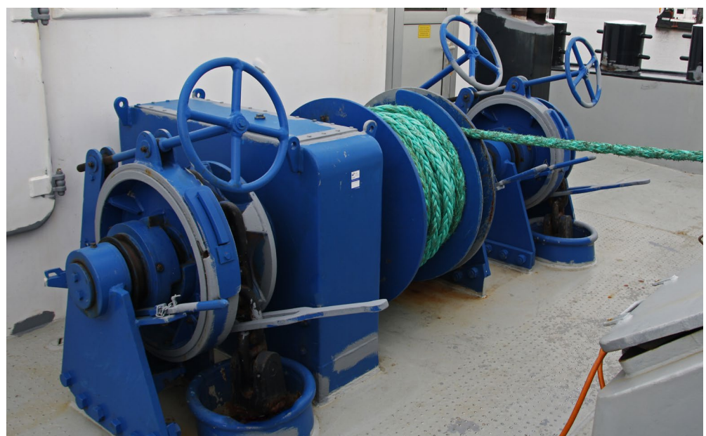
Abb. 1 Gerade Ankerwinden müssen geprüft sein

Für Güterschiffe, die den Vorschriften einer anerkannten Klassifikationsgesellschaft entsprechen, sind in dieser Prüfinformation keine Detailprüfungen aufgeführt, die ausschließlich anlässlich einer Klassenbesichtigung durchgeführt werden müssen. Diese Prüfungen und deren Dokumentation werden von der Klassifikationsgesellschaft und nicht von Schiffseignern veranlasst und verantwortet.