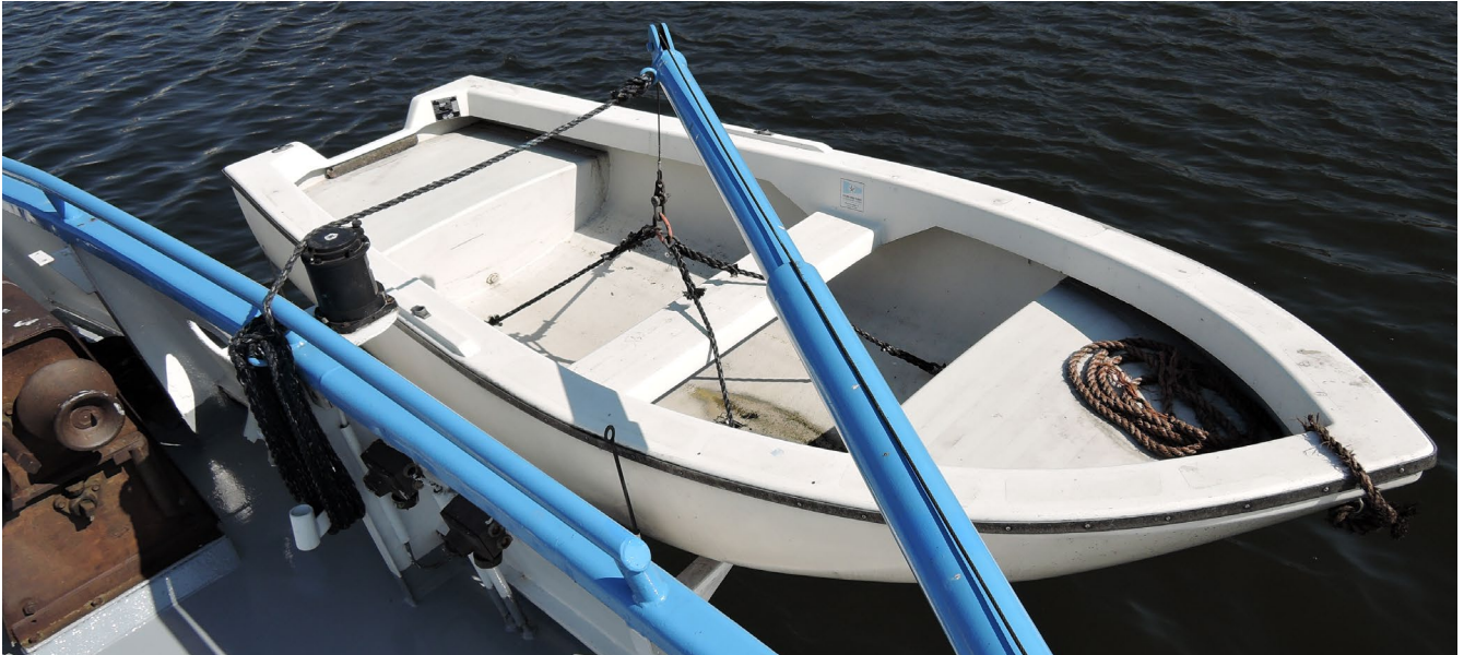
Abb. 4 Das Beiboot muss geprüft sein

Von den Vorschriften über die Verkehrszulassung sind folgende Maschinen erfasst