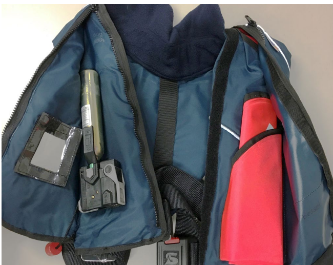
Abb. 10 Ein möglicher Lebensretter – immer geprüft!

Die Fristen für die wiederkehrenden Prüfungen sind so festzulegen, dass die Arbeitsmittel bis zur nächsten festgelegten Prüfung sicher verwendet werden können. Bei der üblichen Nutzung des Objektes bietet es sich an, sich an den in den DGUV Vorschriften angegebenen Fristen zu orientieren. Bei sehr starker Nutzung eines Objektes müssen die Fristen verkürzt werden.