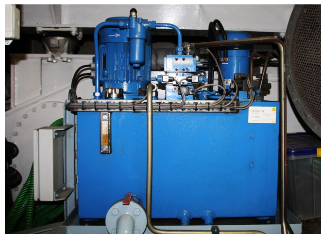
Abb. 3 Auch im ES-TRIN sind Prüfungen geregelt