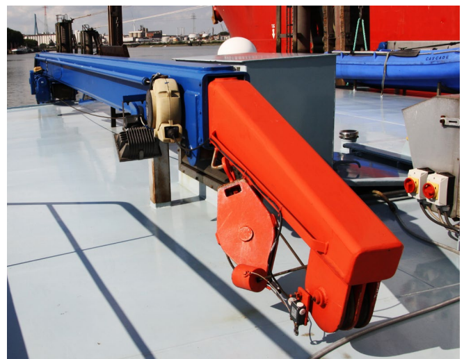
Abb. 11 Für Kranprüfungen gibt es das Prüfbuch