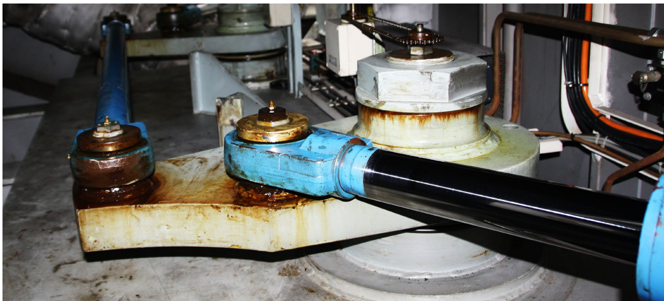
Abb. 8 Prüfungen können Systemausfälle verhindern!