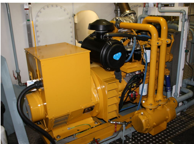
Abb. 2 Das DGUV-Regelwerk legt Prüfintervalle fest (z. B. in der DGUV Vorschrift 3 und 4)

Alles, was bezüglich Bau und Ausrüstung in den staatlichen Vorschriften über die Verkehrszulassung (z. B. Binnenschiffsuntersuchungsordnung, ADN – siehe Abschnitt 2.1.3) gefordert wird, ist Teil des Güterschiffes und wird nicht durch das Produktsicherheitsgesetz, sondern durch die in den Abschnitten 2.1.3 und 2.1.4 genannten Vorschriften geregelt.