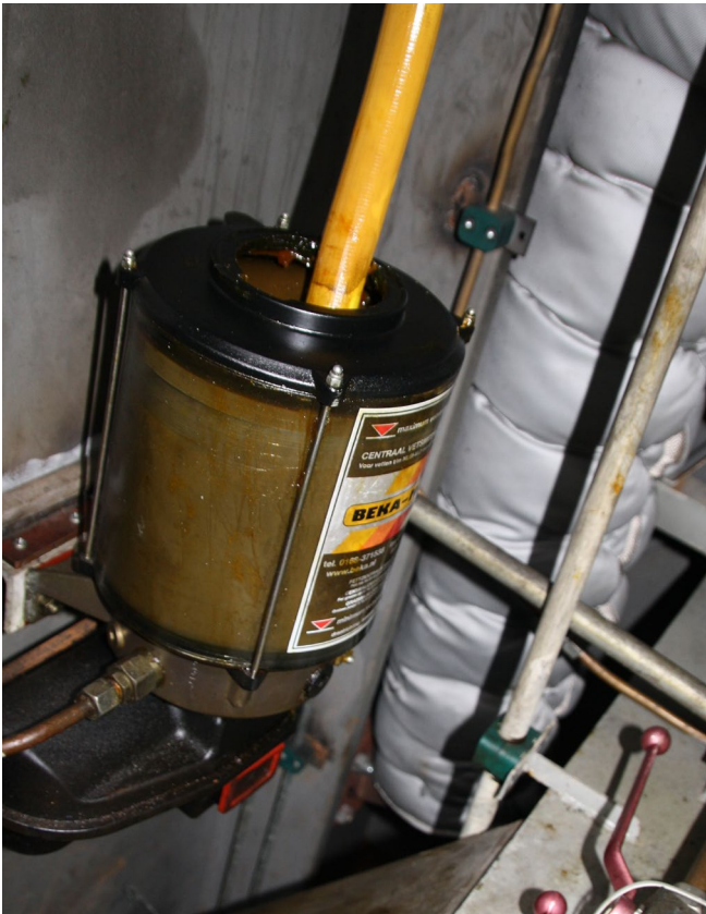
Abb. 12 Regelmäßige Wartung erhöht die Systemsicherheit