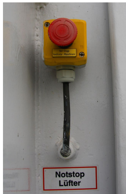
Abb. 7 Sicherheitseinrichtungen müssen regelmäßig geprüft werden