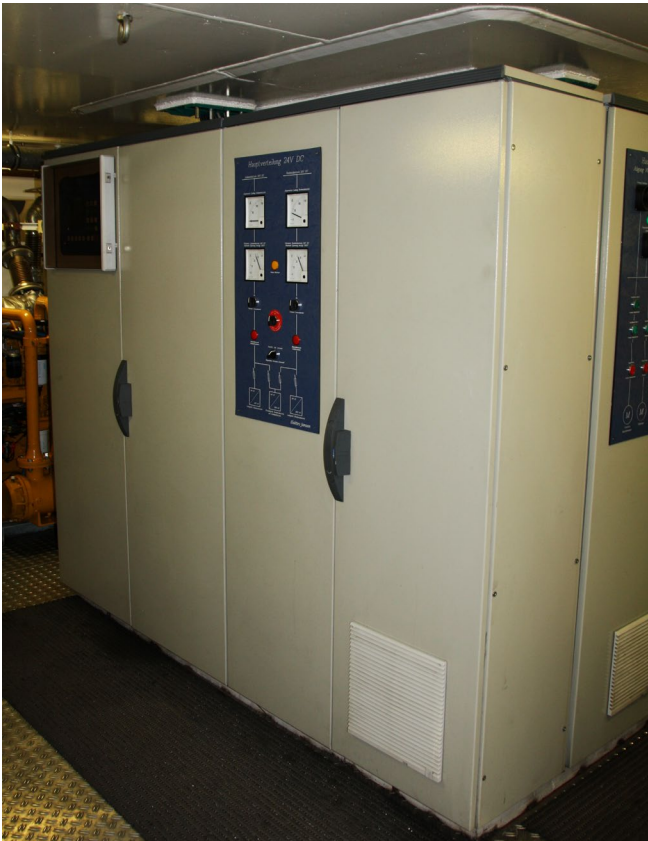
Abb. 9 Elektroprüfungen benötigen Fachkompetenz