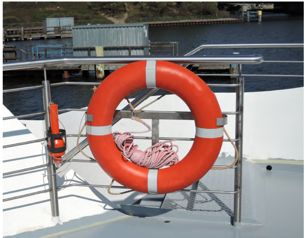
Abb.6 Selbst am Rettungsring gibt es viel zu prüfen.

Droht dem Unternehmer in einem solchen Fall die Inanspruchnahme auf Zahlung von Schadensersatz, ein strafrechtliches Ermittlungsverfahren oder ein behördliches Bußgeld, muss er nachweisen, dass er seinen Sorgfalts- bzw. Prüfpflichten nachgekommen ist. Zur eigenen Absicherung ist es daher unerlässlich, dass die durchgeführten Prüfungen und Angaben, die auch die ausreichende Qualifikation der Prüfenden belegen, entsprechend festgehalten werden.