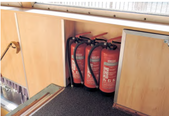
Abb.9 Die Feuerlöscher prüft der Sachkundige

Bei üblicher Nutzung des Objektes bietet es sich an, sich an den in den DGUV Vorschriften angegebenen Fristen zu orientieren. Bei sehr starker Nutzung eines Objektes müssen die Fristen verkürzt werden.