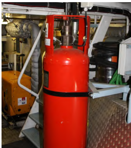
Abb. 5 Prüfungen sind auch eine Frage der Verantwortung

Unternehmer haben nicht nur die ethische Verpflichtung, die Arbeit an Bord so zu gestalten und zu organisieren, dass Arbeitsunfälle vermieden werden. Das Unterlassen von Prüfungen der zur Benutzung bereitgestellten Arbeitsmittel oder überwachungsbedürftigen Anlagen (z. B. Druckluftbehälter) und der Dokumentation dieser Prüfungen kann empfindliche juristische Konsequenzen nach sich ziehen.