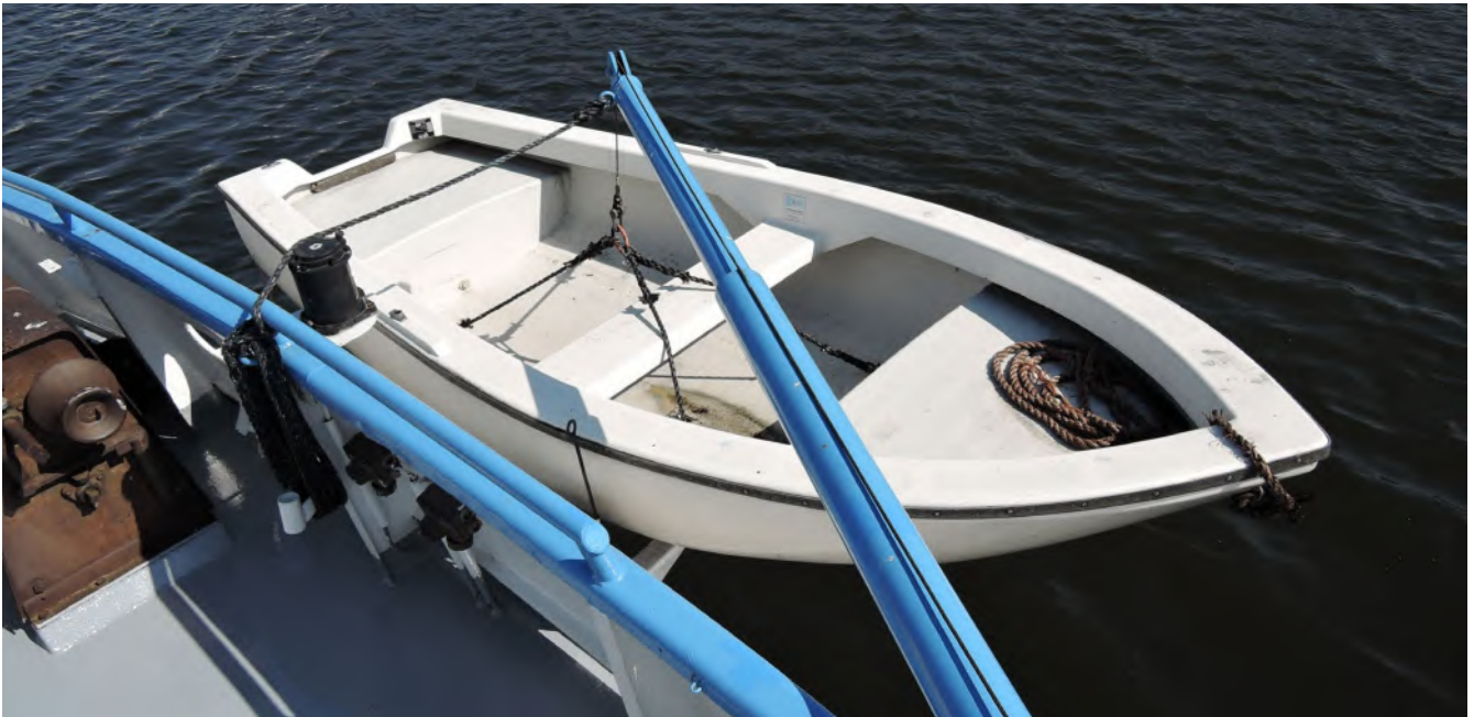
Abb. 4 Regelmäßig geprüft bringt es Sicherheit