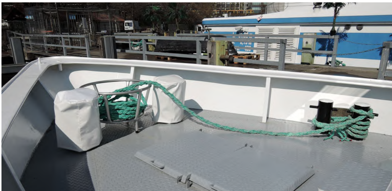
Abb.7 Das Tauwerk braucht eine regelmäßige Sichtprüfung