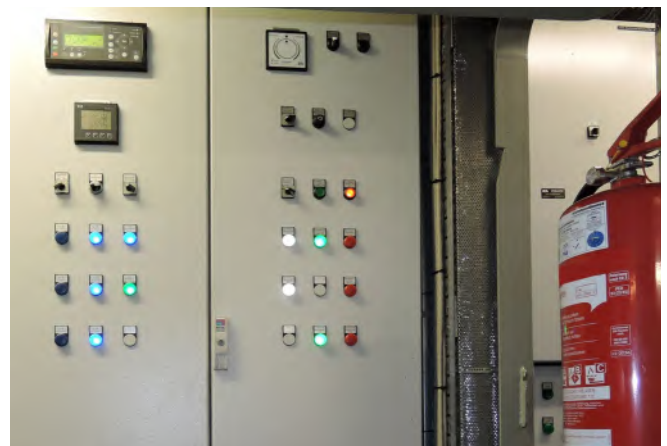
Abb.10 Elektroprüfungen sind nur mit Fachkompetenz möglich