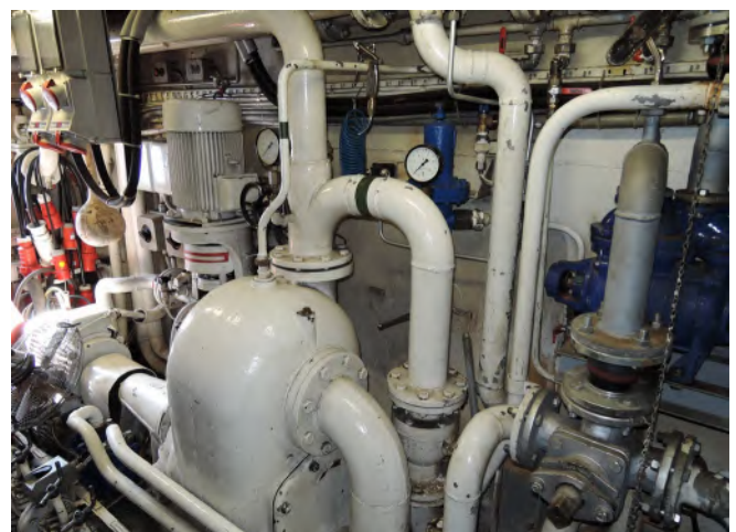
Abb. 3 Auch in der BinSchUO sind Prüfungen geregelt.