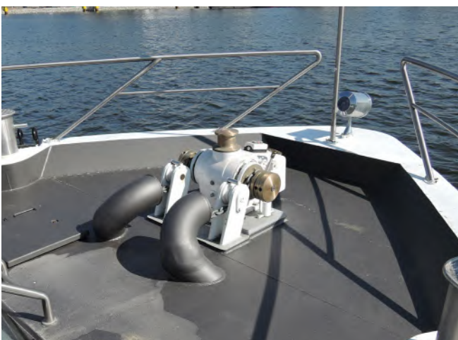
Abb. 2 Gerade Ankerwinden müssen geprüft sein

Alles, was bezüglich Bau und Ausrüstung in den staatlichen Vorschriften über die Verkehrszulassung (z. B. Binnenschiffsuntersuchungsordnung – siehe Abschnitt 2.1.3) gefordert wird, ist Teil des Fahrgastschiffes und wird nicht durch das Produktsicherheitsgesetz, sondern durch die in den Abschnitten 2.1.3 und 2.1.4 genannten Vorschriften geregelt.