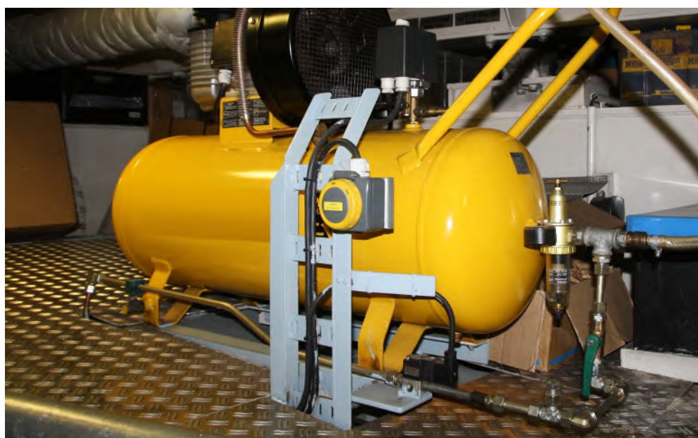
Abb. 1 Prüfungen sind Voraussetzung für den sicheren Betrieb

Für Fahrgastschiffe, die den Vorschriften einer anerkannten Klassifikationsgesellschaft entsprechen, sind in dieser Prüfinformation keine Detailprüfungen aufgeführt, die ausschließlich anlässlich einer Klassenbesichtigung durchgeführt werden müssen. Diese Prüfungen und deren Dokumentation werden von der Klassifikationsgesellschaft und nicht von Schiffseignerinnen und Schiffseignern veranlasst und verantwortet.