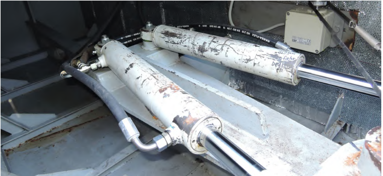
Abb.11 Prüfungen können Systemausfälle verhindern!

Nur ein Beispiel: Das stets und ständig verwendete Verlängerungskabel (siehe Anhang 4 Nr. 3.6 und 3.7), das unter allen Witterungsbedingungen zum Einsatz kommen soll, bedarf einer kurzfristigeren Prüfung, als eines, das nur gelegentlich in der Wohnung verwendet wird.