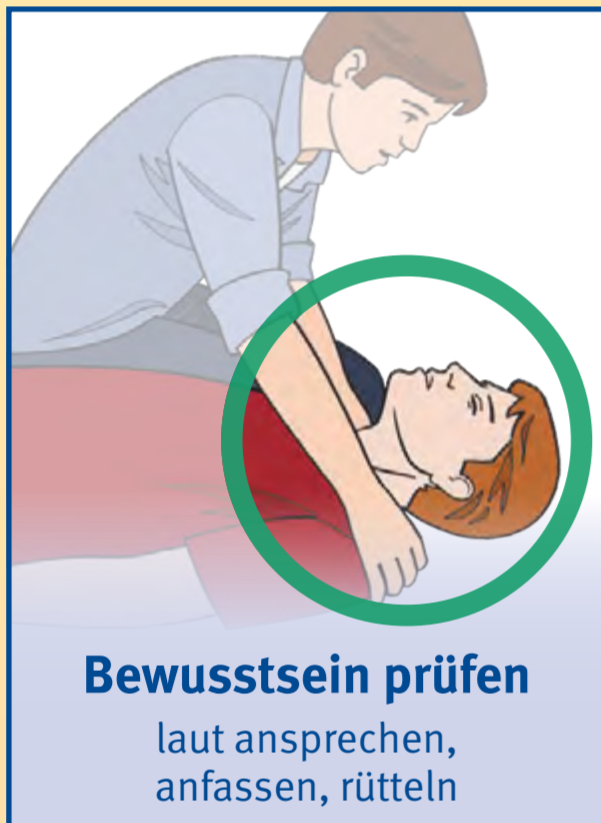
Bewusstsein prüfen laut ansprechen, anfassen, rütteln