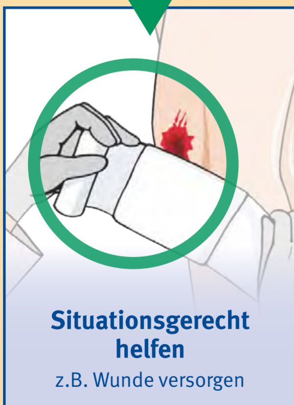
Situationsgerecht helfen z.B. Wunde versorgen