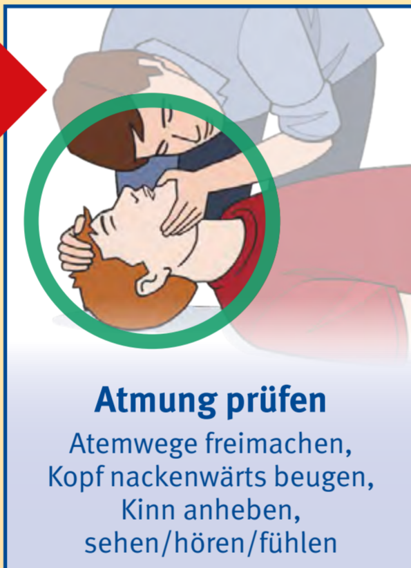
Atemung prüfen Atemwege freimachen, Kopf nackenwärts beugen, Kinn anheben, sehen/hören/fühlen