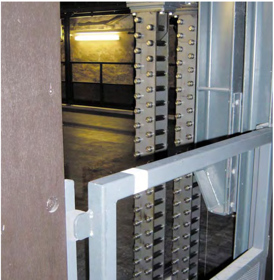
Antrieb einer Versenkeinrichtung mit Schubketten