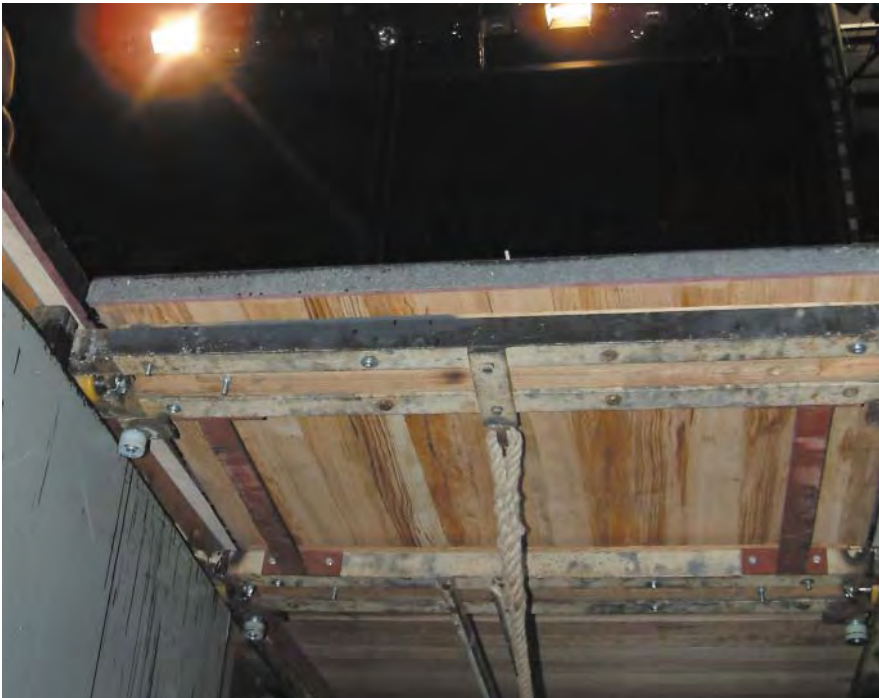
Der Schieber im Bühnenboden wird für einen Auftritt geöffnet

Versenkeinrichtungen werden in Veranstaltungs-, Versammlungs- und Produktionsstätten für szenische Darstellung, z.B. in Theatern, Mehrzweckhallen, Studios, Produktionsstätten bei Film, Fernsehen und Hörfunk, Konzertsälen, Kongresszentren, Schulen, Ausstellungen, Messen, Museen, Diskotheken, Varietés, Freizeitparks, Sportstätten, Freilichtbühnen und Open-Air-Veranstaltungen eingesetzt.