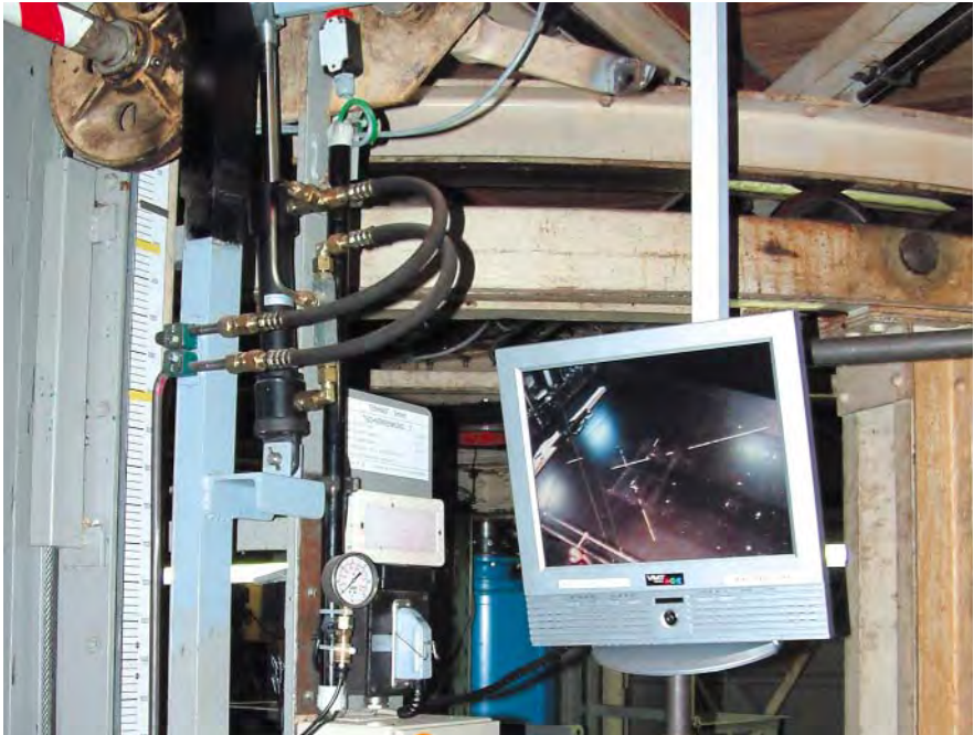
Steuerstand einer Versenkeinrichtung mit Überwachungsmonitor für die Szenefläche

Der Unternehmer hat gemäß § 3 der Betriebssicherheitsverordnung (BetrSichV) und § 5 des Arbeitsschutzgesetzes unter Berücksichtigung der allgemeinen Grundsätze des § 4 des Arbeitsschutzgesetzes die notwendigen Maßnahmen für die sichere Bereitstellung und Benutzung der Arbeitsmittel zu ermitteln. Dabei hat er insbesondere die Gefährdungen zu berücksichtigen, die mit der Benutzung des Arbeitsmittels selbst verbunden sind und die am Arbeitsplatz durch Wechselwirkungen der Arbeitsmittel untereinander oder mit Arbeitsstoffen oder der Arbeitsumgebung hervorgerufen werden.