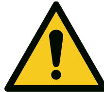
Abb. 7 Warnschilden W001 „Allgemeines Warnschild“