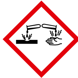
Abb. 14 Kennzeichnung eines Stoffes mit Ätzwirkung

Für Reinigung und Desinfektion sind nur Produkte zu verwenden, für die der Hersteller bescheinigt hat, dass sie dem Stand der Technik entsprechen und unter Berücksichtigung der Getränk-