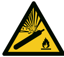
Abb. 2 Warnzeichen W029 „Warnung vor Gasflaschen“

Aufstellungsräume für zum Entleeren angeschlossene Druckgasflaschen sind