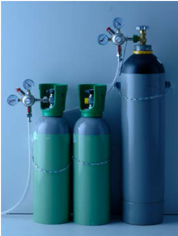
Abb. 3 Entleeren und Bereithalten von Druckgasflaschen

Abweichend von Abschnitt 5.2.2.2 dürfen in Räumen unter Erdgleiche, die eine Grundfläche \leq 12 \text{ m}^2 haben und die allseitig mit festen öffnungslosen Wänden von mehr als 1,5 m Höhe umgeben sind, bis zu zwei Druckgasflaschen mit einem maximalen Fassungsvermögen von je 14 l bzw. 10 kg Füllgewicht zum Entleeren angeschlossen werden.