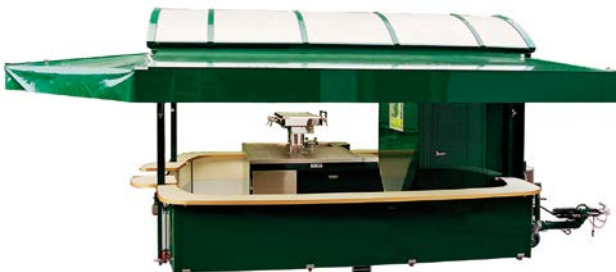
Abb. 10 Beispiel eines Ausschankwagens mit begehbarem Kühlraum und integrierter Getränkeschankanlage