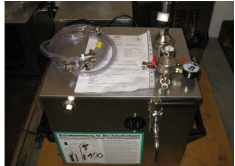
Abb. 9 Beispielhafte nicht verwendungsfertige Getränkeschankanlage

Maßnahmen zum Personenschutz erforderlich, zum Beispiel: