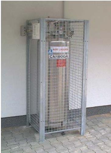
Abb. 5 Aufstellungsbeispiel für einen stationären Druckbehälter