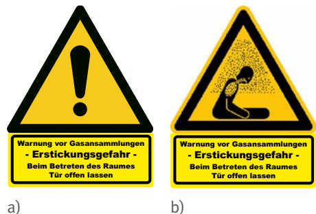
Abb. 1 Warnzeichen: a) W001 „Allgemeines Warnzeichen“ b) W041 „Warnung vor Erstickungsgefahr“ mit Zusatzschild „Warnung vor Gasansammlungen – Erstickungsgefahr“

An den Zugängen zu allen Räumen, in denen eine Gefährdung durch ausströmende Schankgase entstehen kann, sind Warnzeichen gemäß Abbildung 1a oder 1b deutlich sichtbar und dauerhaft anzubringen. Hinsichtlich der Größe und Kennzeichnung siehe Technische Regeln für Arbeitsstätten „Sicherheits- und Gesundheitsschutzkennzeichnung“ (ASR A1.3).