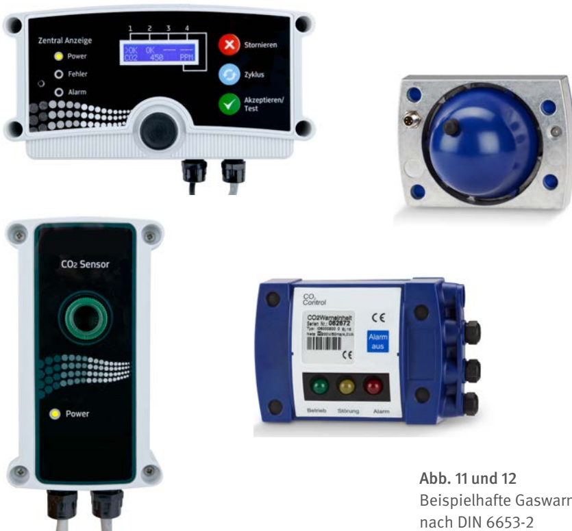
Abb. 11 und 12 Beispielhafte Gaswarnanlagen nach DIN 6653-2