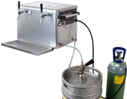
Abb. 8 Beispielhafte verwendungsfertige Getränkeschankanlage