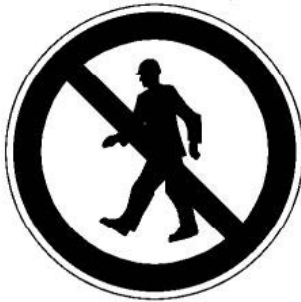
P03 Für Fußgänger verboten

Diese Forderung ist z. B. erfüllt, wenn Aufstiege an den Denneebäumen gesperrt sind und die Absperrung durch das Verbotsschild P 03 „Für Fußgänger verboten“ nach Anlage 2 der UVV „Sicherheits- und Gesundheitsschutzkennzeichnung am Arbeitsplatz“ (GUV-V A 8, bisher GUV 0.7) gekennzeichnet ist.