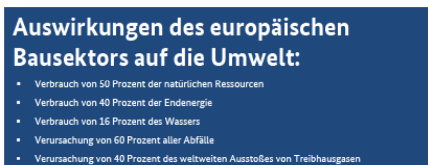
Abb. 2.5: Auswirkungen des europäischen Bausektors (Ebert et al., 2010)

Zur Sicherung der Lebensqualität zukünftiger Generationen muss daher der nachhaltige und effiziente Umgang mit den Ressourcen unseres Planeten gewährleistet werden. Diese Forderung gilt als übergeordnetes Ziel auch für den Sportstättenbau. Betrachtet man die Auswirkungen der Baubranche auf die Umwelt, so ist deren Einfluss enorm. Der europäische Bausektor verbraucht etwa 50 Prozent der natürlichen Ressourcen sowie 40 Prozent der Energie und 16 Prozent des Wassers. Zudem verursacht das Bauwesen rund 60 Prozent aller Abfälle. Darüber hinaus resultieren rund 40 Prozent des weltweiten Ausstoßes von Treibhausgasen aus der Gebäudeherstellung und -nutzung (Ebert et al., 2010).