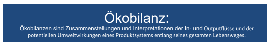
Abb. 8.1: Definition Ökobilanzierung

Derzeit spielt in der Planung von Sporthallen jedoch der Lebenszyklus in seiner Gesamtheit keine entscheidende Rolle. Während beispielsweise für die Kosten meist nur die Herstellungsphase maßgebend ist, wird für die energetische Bilanzierung nur die Nutzungsphase herangezogen. Im Sinne einer effizienten Nutzung von Ressourcen gilt es jedoch, diese Sichtweise aufzuheben und den gesamten Lebenszyklus zu analysieren.