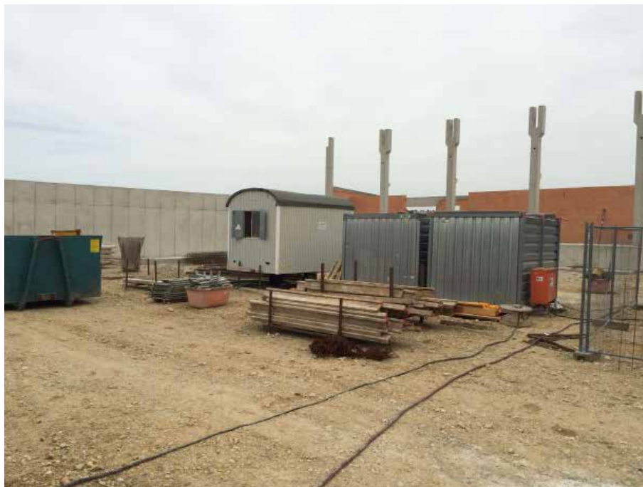
Abb. 4.1: Baustelle der Sporthalle „Am Sportpark, Zorneding“

Durch den Einbezug von Nachhaltigkeitsaspekten in die Ausschreibung kann die ökologische und soziale Gebäudequalität der Sporthalle erhöht werden, da die Bauprozentscheidungen nicht ausschließlich aus ökonomischen Gründen getroffen werden. Die Berücksichtigung von Nachhaltigkeitsaspekten bei der Auswahl von Firmen dient dem Ziel der Verbesserung der Bauqualität, der Förderung und des Erhalts von Arbeitsplätzen in der Region und der Durchsetzung von Umwelt- und Sozialstandards im Rahmen des Bauprozesses der Sporthalle (Bundesministerium für Umwelt, Naturschutz, Bau und Reaktorsicherheit, 2013).