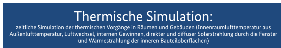
Abb. 6.2: Definition „Thermische Simulation“