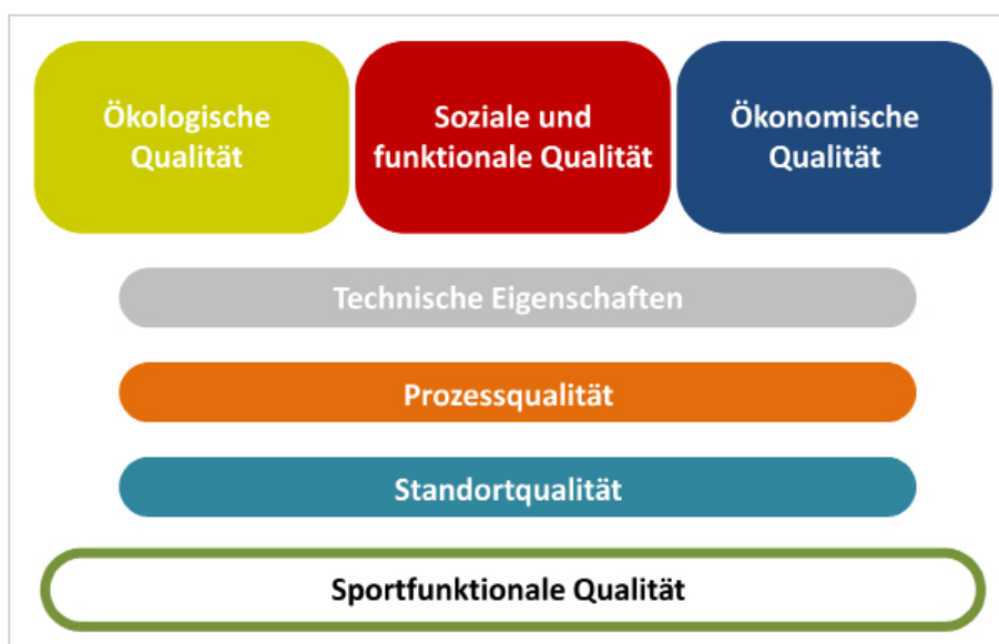
Abb. 2.7: Aspekte des nachhaltigen Sporthallenbaus

Für die Planung und Beurteilung der nachhaltigen Gebäudequalität von Sporthallen gilt es daher, gleichberechtigt ökologische, ökonomische und soziale Faktoren zu berücksichtigen. Zudem werden die technische Charakteristik, die Prozessqualität und der Standort des Gebäudes beurteilt. Für die Typologie der Sportraumplanung und des Sportstättenbaus gilt es, ergänzend die sportfunktionale Qualität zu integrieren.