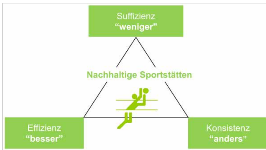
Abb. 2.4: Definition für nachhaltige Sportstätten

Zur Sicherung der Lebensqualität zukünftiger Generationen muss daher der nachhaltige und effiziente Umgang mit den Ressourcen unseres Planeten gewährleistet werden. Diese Forderung gilt als übergeordnetes Ziel auch für den Sportstättenbau. Betrachtet man die Auswirkungen der Baubranche auf die Umwelt, so ist deren Einfluss enorm. Der europäische Bausektor verbraucht etwa 50 Prozent der natürlichen Ressourcen sowie 40 Prozent der Energie und 16 Prozent des Wassers. Zudem verursacht das Bauwesen rund 60 Prozent aller Abfälle. Darüber hinaus resultieren rund 40 Prozent des weltweiten Ausstoßes von Treibhausgasen aus der Gebäudeherstellung und -nutzung (Ebert et al., 2010).