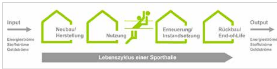
Abb. 2.8: Lebenszyklus einer Sporthalle (Essig, 2010)

Im Rahmen des Forschungsprojekts zum Leitfaden Nachhaltiger Sportstättenbau wurde auf die Kriterienstruktur des Bewertungssystems Nachhaltiges Bauen (BNB) des BMUB zurückgegriffen (Bundesministerium für Umwelt, Naturschutz, Bau und Reaktorsicherheit, 2013). Der bestehende Kriterienkatalog für den Neubau für Büro- und Verwaltungsbauten wurde hinsichtlich der Gebäudetypologie „Neubau Sporthalle“ analysiert und neue Kriterien für den Sporthallenbau nach Bedarf ergänzt.