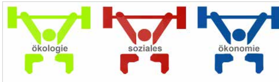
Abb. 2.3: Die drei Dimensionen der Nachhaltigkeit

Auch wenn die Verbindung zwischen Sport und Nachhaltigkeit nicht immer auf den ersten Blick ersichtlich ist, so sind doch zahlreiche vielfältige Verknüpfungen erkennbar. Hierbei kommt dem Raum, in dem der Sport betrieben wird, eine wichtige Rolle zu, sowohl in gesellschaftlicher, wirtschaftlicher als auch ökologischer Hinsicht.