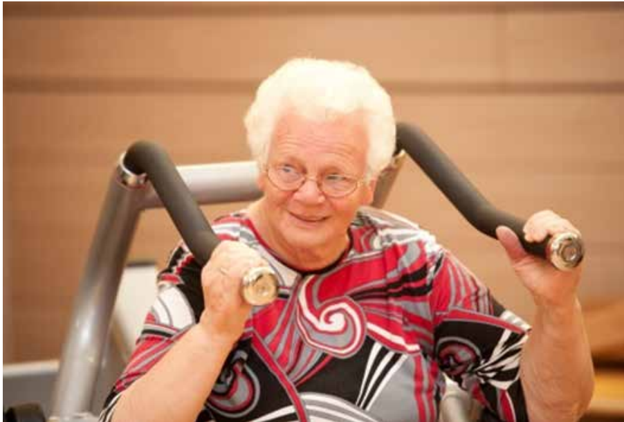
Abb. 5.1: Einfluss des demografischen Wandels auf Sporthallen