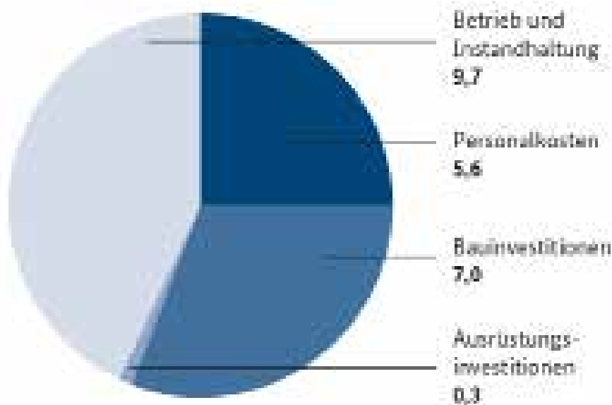
Abb. 2.2: Wirtschaftliche Bedeutung der Sportstätten für das Jahr 2008 (Bundesministerium für Wirtschaft und Technologie, 2012)

Jedoch sind die Bauinvestitionen von Sportanlagen für viele Kommunen bei weitem nicht so belastend wie die laufenden Betriebskosten. So zeigt die im Jahr 2012 vom Bundesministerium für Wirtschaft und Technologie herausgebrachte Studie über die aktuelle wirtschaftliche Bedeutung des Sportstättenbaus in Deutschland, dass die Betriebs- und Instandhaltungskosten mit 9,7 Milliarden Euro den größten Anteil (ca. 43 Prozent) am Gesamtvolumen für den Sportstättenbau im Jahr 2008 ausmachten.