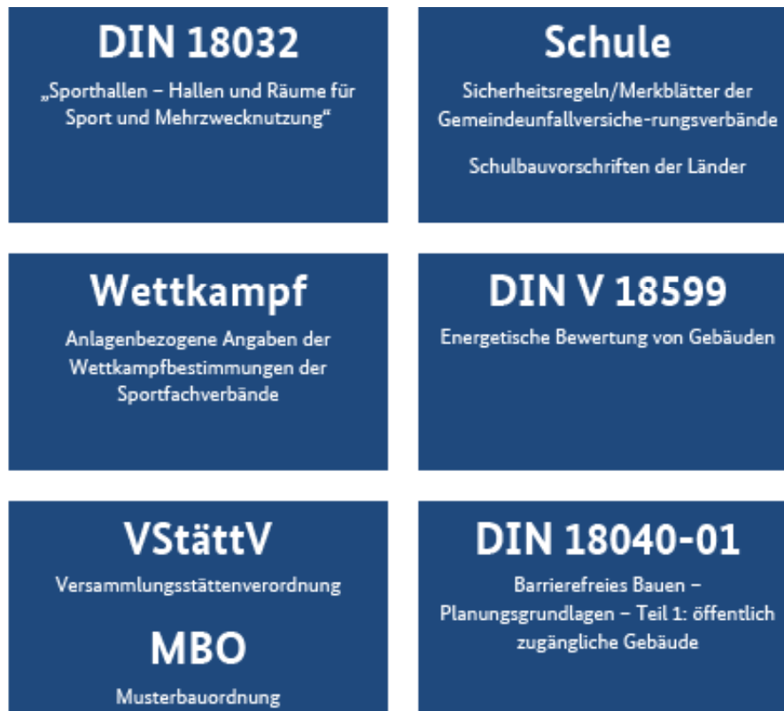
Abb. 3.2: Technische Regelwerke für Sporthallen mit Mehrzwecknutzung

Darüber hinaus haben Sportinstitutionen und -verbände sowie das Bundesinstitut für Sportwissenschaft (BISp) zahlreiche Informationsbroschüren veröffentlicht, die sich mit der Planung und dem Betrieb bzw. mit Teilbereichen des Sportstättenbaus befassen. Weitere ausgewählte Normen, technische Regelwerke Planungshilfen und Leitlinien zu Sporthallen sind in den jeweiligen Kapiteln zusammengefasst.