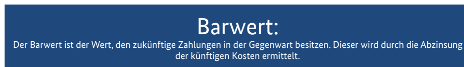
Abb. 9.2: Barwert (Bundesministerium für Umwelt, Naturschutz, Bau und Reaktorsicherheit, 2013)

Die Ermittlung der Herstellkosten für die Lebenszykluskostenbetrachtung einer Sporthalle erfolgt im Rahmen der Planung auf Basis der Kostenermittlung nach Fertigstellung der Halle mit Hilfe der Kostenfeststellung (Bundesministerium für Umwelt, Naturschutz, Bau und Reaktorsicherheit, 2016).