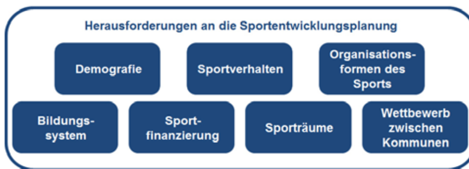
Abb. 3.1: Herausforderungen an die Sportentwicklungsplanung

Veränderungen in der Bevölkerungsstruktur, im Sportverhalten, im Bildungssystem oder bei den öffentlichen Haushalten sind nur einige der Herausforderungen, die auf die heutige Sportentwicklungsplanung einwirken. Folglich verändert sich die Nutzung und damit die Anforderungen an die Sporträume (Wetterich et al., 2009). Berücksichtigt man die Bedeutungssteigerung und die zahlreichen positiven sozialen Beiträge des Sports, so eröffnen sich darüber hinaus neue Handlungsmöglichkeiten für den Sportstättenbau (Ad-hoc-Ausschuss „Sportentwicklung“ der Deutschen Vereinigung für Sportwissenschaft, 2010).